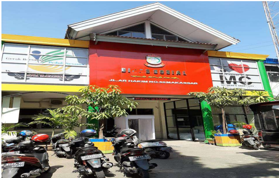
Foto Halaman Depan Dinas Sosial Kota Makassar