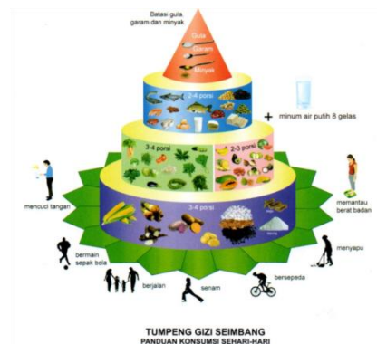
Gambar 2. 1Tumpeng Gizi Seimbang

Visual gizi seimbang adalah bentuk gizi seimbang yang menggambarkan semua prinsip gizi seimbang, yakni pangan yang beragam, kebersihan dan keamanan pangan, aktivitas fisik, dan pemantauan berat badan di suatu wilayah atau bangsa. Ada dua visual gizi seimbang, yakni 1) Tumpeng gizi seimbang dan 2) Piring makanku, porsi sekali makan.