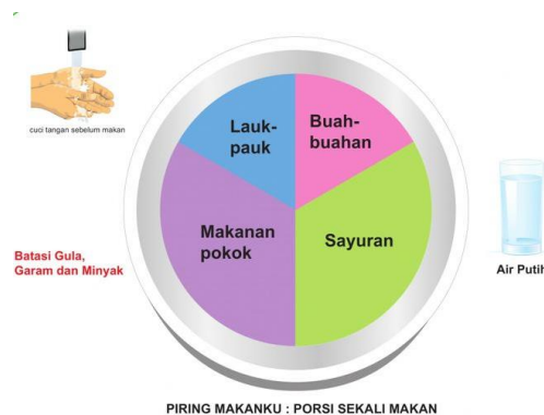
Gambar 2. 2Piring Makanku

tumpeng semakin kecil berarti pangan pada lapis paling atas yaitu gula, garam, dan lemak dibutuhkan sedikit sekali atau perlu dibatasi. Pada setiap kelompok pangan dituliskan berapa jumlah porsi setiap kelompok pangan yang dianjurkan. Selain makanan dan minuman dalam visual tumpeng gizi seimbang juga ada pesan cuci tangan menggunakan air mengalir; juga berbagai siluet aktivitas fisik (termasuk olahraga), dan kegiatan menimbang berat badan.