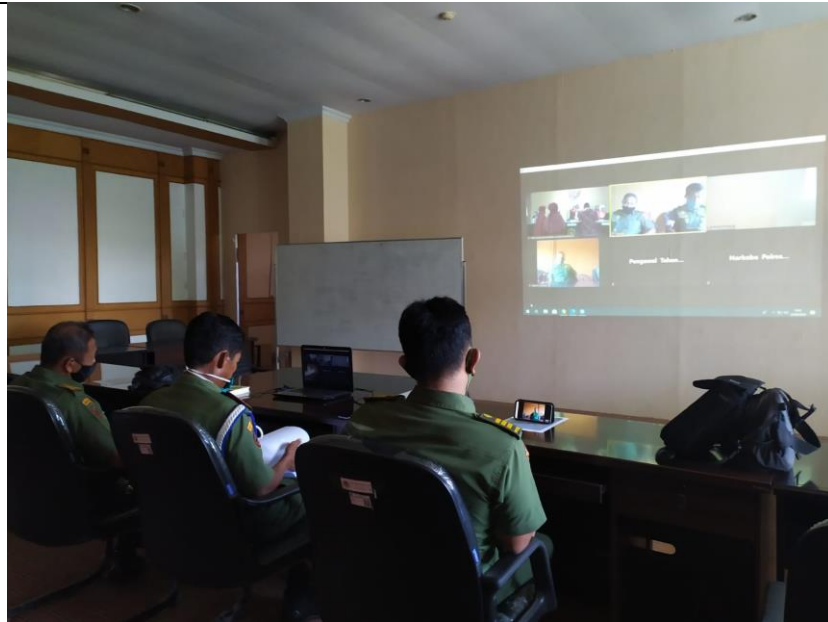
Pelaksanaan Sidang Secara Online