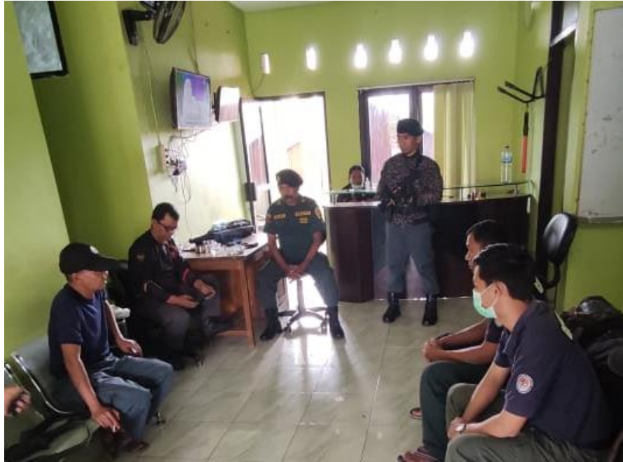
Melakukan Diskusi dengan Anggota SPORC Brigade Anoa