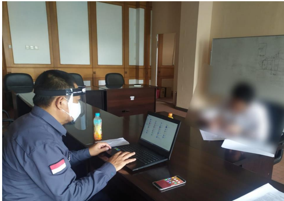
Proses Penyidikan Selama Pandemi Covid-19