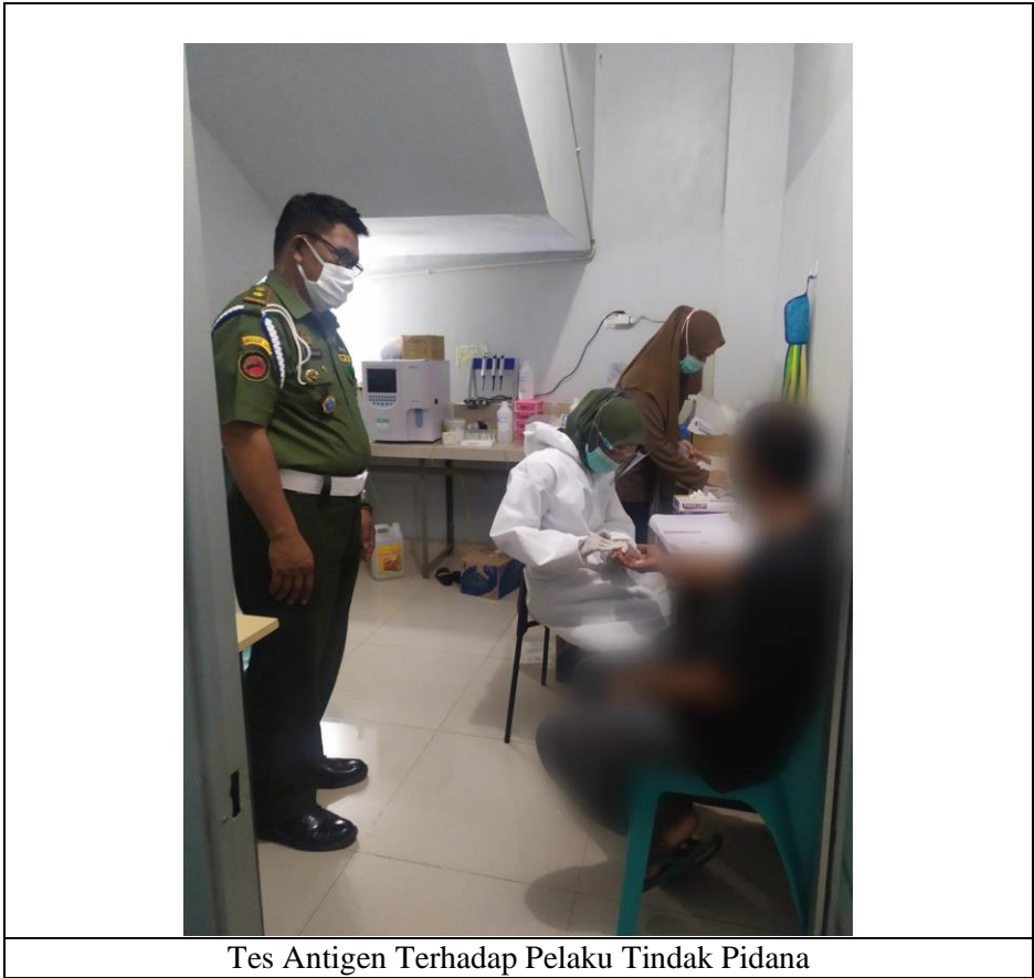
Tes Antigen Terhadap Pelaku Tindak Pidana