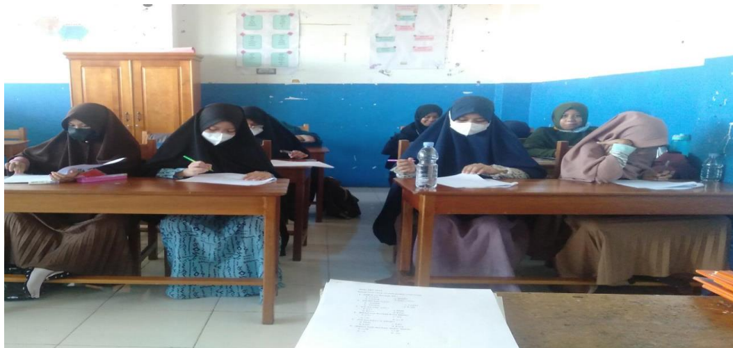
Tes kusioner akhir