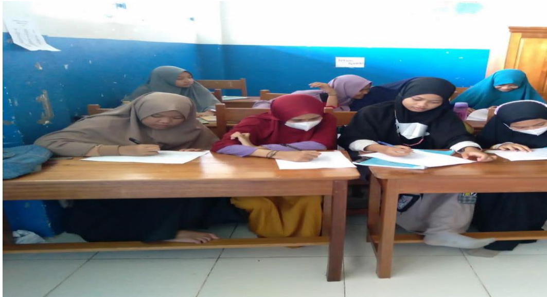
Tes kusioner awal