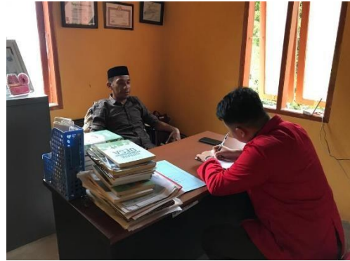
Wawancara Informan SYRLH