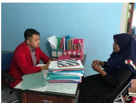
Wawancara Informan LA