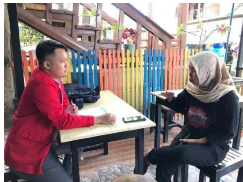
Wawancara Informan AI