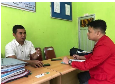
Wawancara Informan SPRN