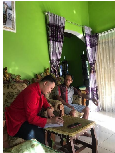
Wawancara Informan RJ