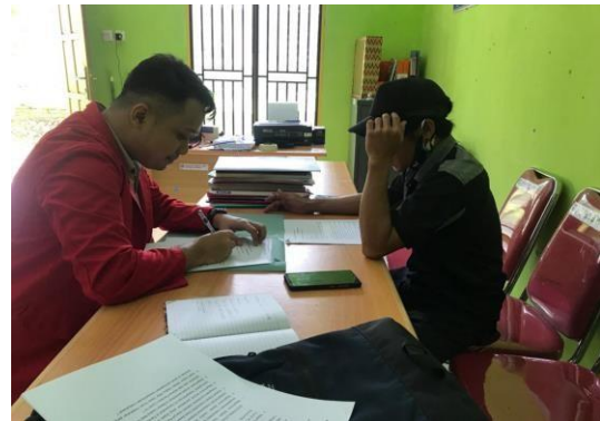
Wawancara Informan AY