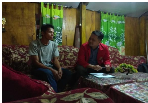
Wawancara Informan SPWI