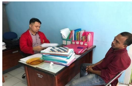
Wawancara Informan IE