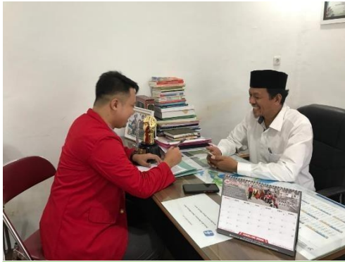
Wawancara Informan AR