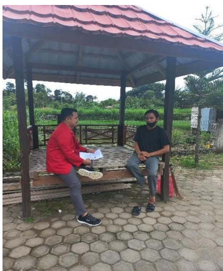
Wawancara Informan RS