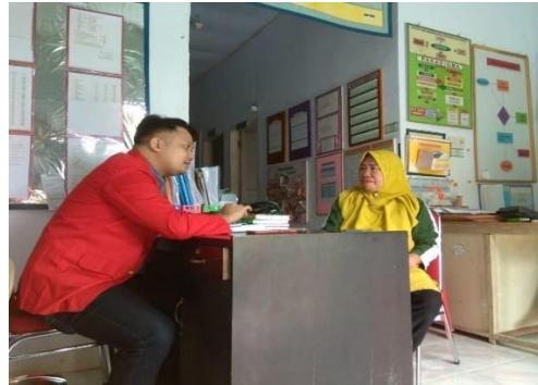
Wawancara Informan HSBH