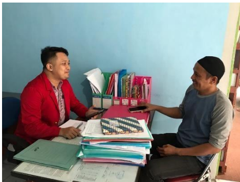
Wawancara Informan MA