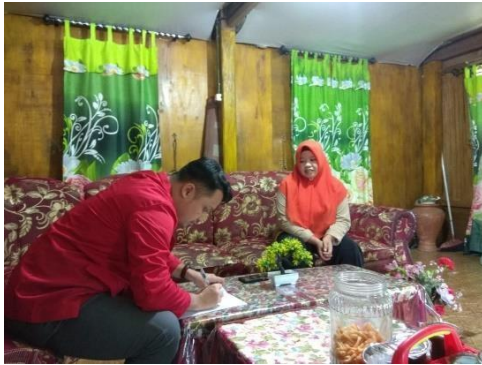
Wawancara Informan NW