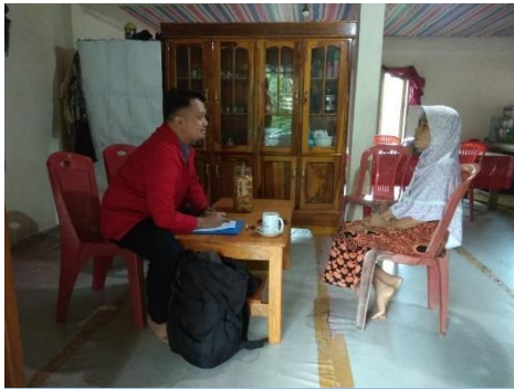
Wawancara Informan MN