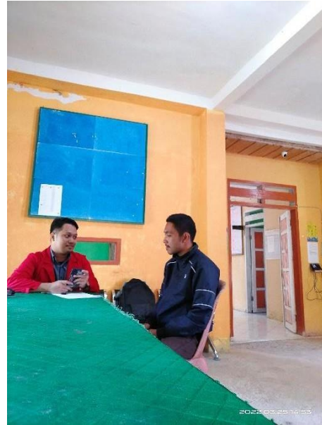
Wawancara Informan HMZ