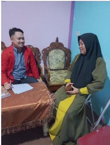
Wawancara Informan JSNT