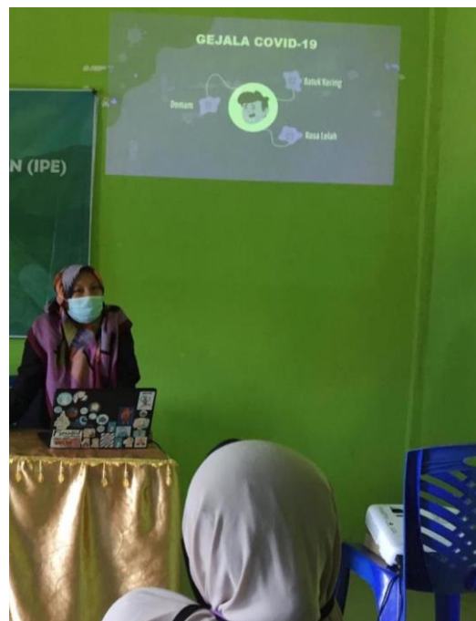
Penyuluhan Covid-19 Desa Taulan