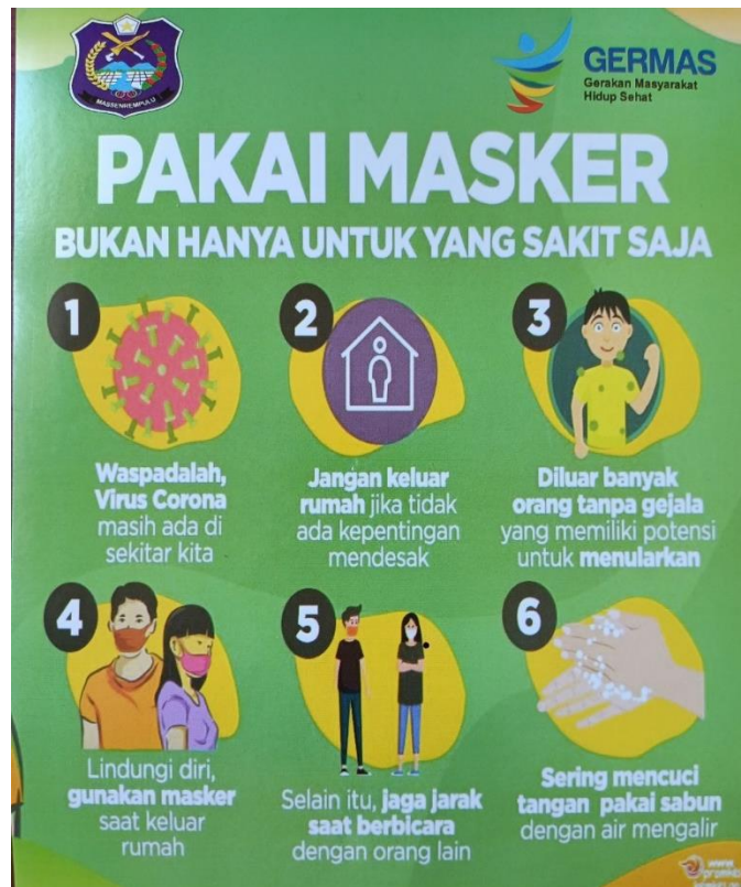
Upaya Penyebaran Informasi terkait Covid-19 di Kecamatan Cendana