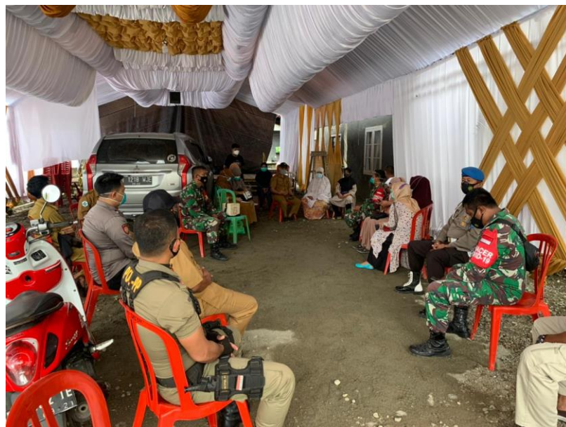
Himbauan Untuk Tidak Mangadakan Kerumunan di Desa Cendana