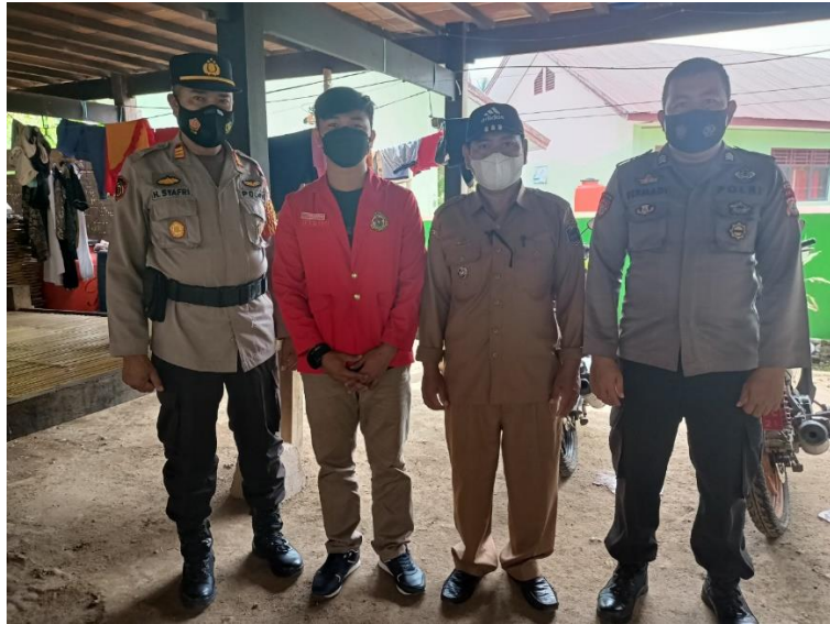
Pelaksanaan Vaksinasi di Dusun Panette Desa Lebang