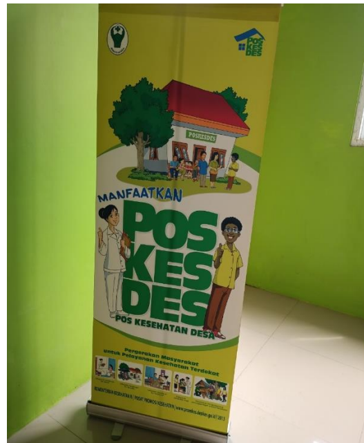
Upaya Penyebaran Informasi terkait Covid-19 di Kecamatan Cendana