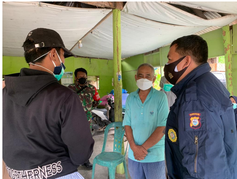
Pemantauan Pasien Covi-19 di Dusun Riso Desa Pinang