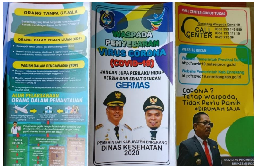
Upaya Penyebaran Informasi terkait Covid-19 di Kecamatan Cendana