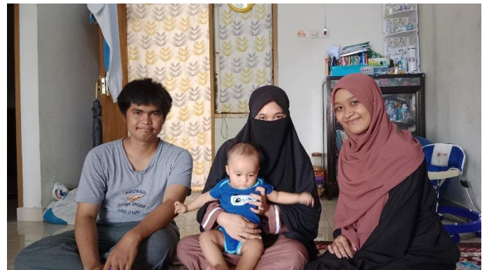
Wawancara dengan Informan ketiga dan keempat dari pasangan kedua, NT dan MPP (Kamis, 24 Maret 2022)