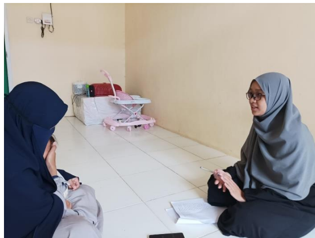
Wawancara dengan Informan pertama dari pasangan pertama, SBS (Selasa, 15 Maret 2022)