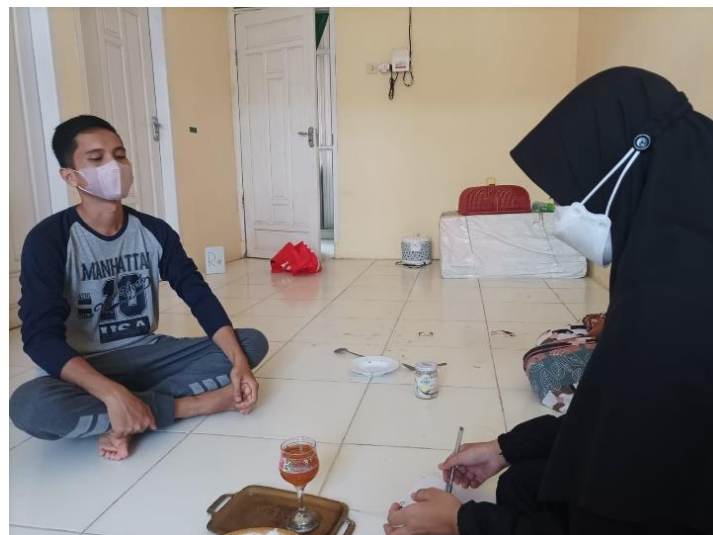
Wawancara dengan Informan kedua dari pasangan pertama, RS (Minggu, 20 Maret 2022)