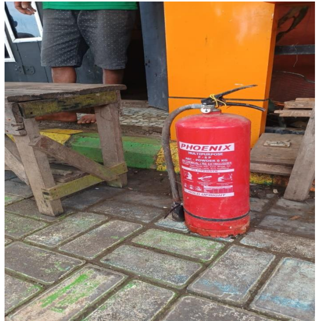
APART RW 4