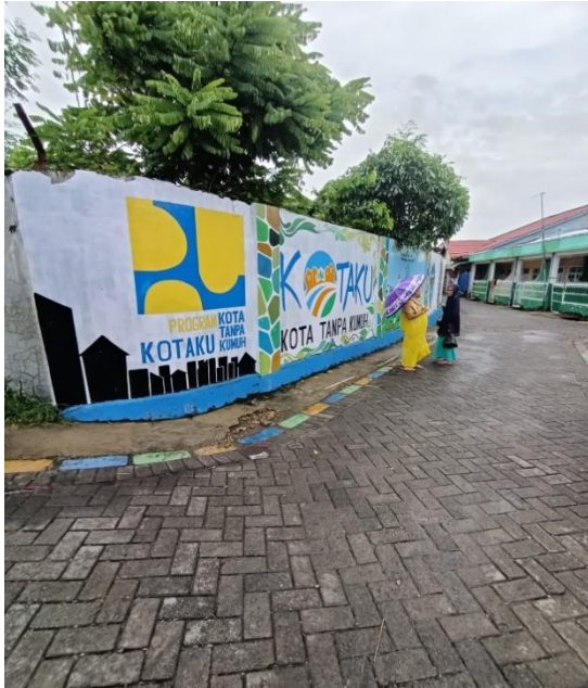
PERBAIKAN PP BLOK DAN SHOW CASE