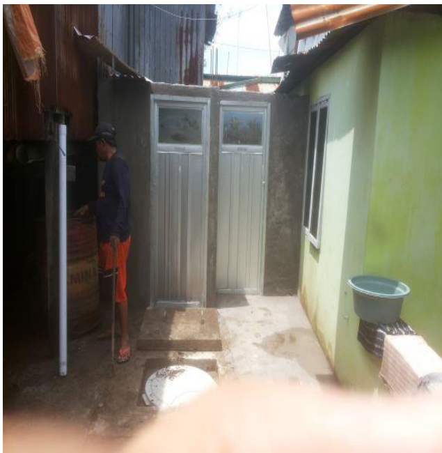
IPAL RW 5