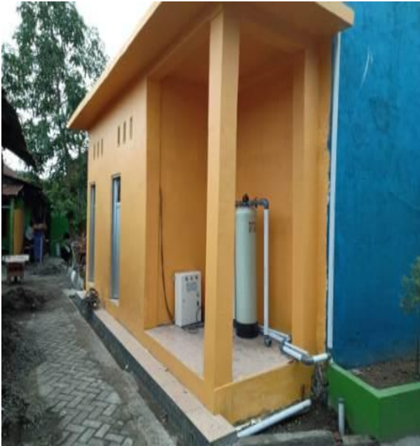
IPAS RW 4