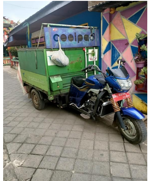
ALAT PENGANGKUT SAMPAH