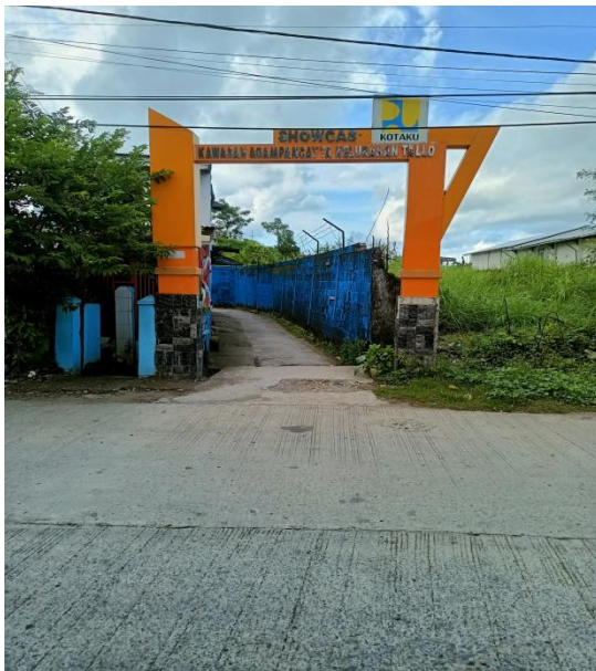
SHOW CASE RW 5