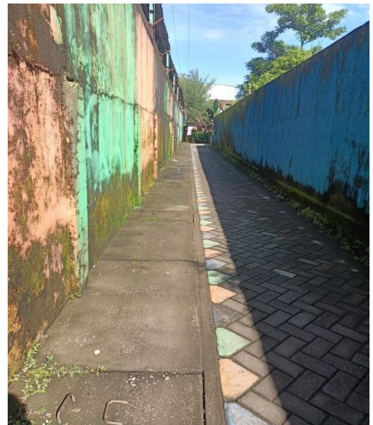
DRAINASE RW 5