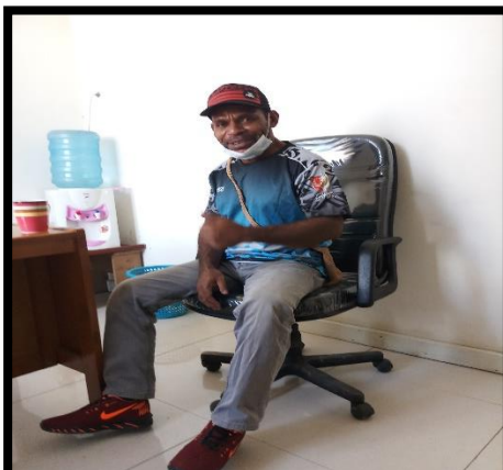
Wawancara dengan Kabid Pelayanan Pendaftaran Penduduk