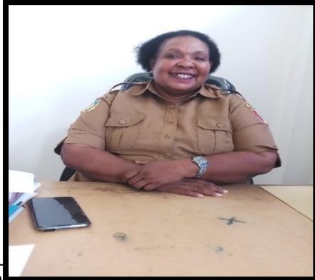
Wawancara dengan P1 Kepala Dinas Kependudukan dan Pencatatan Sipil