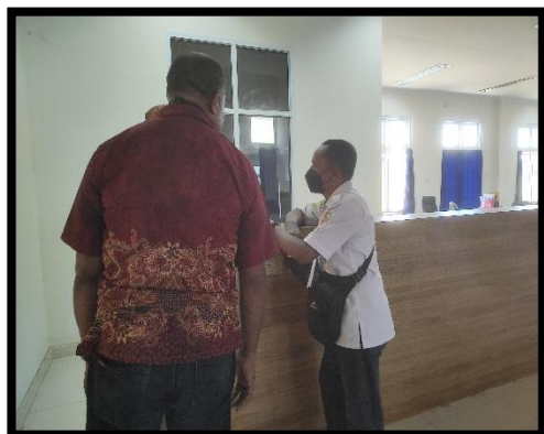
Wawancara dengan Kasubid