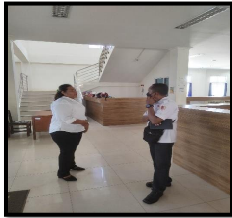
Wawancara dengan Staf