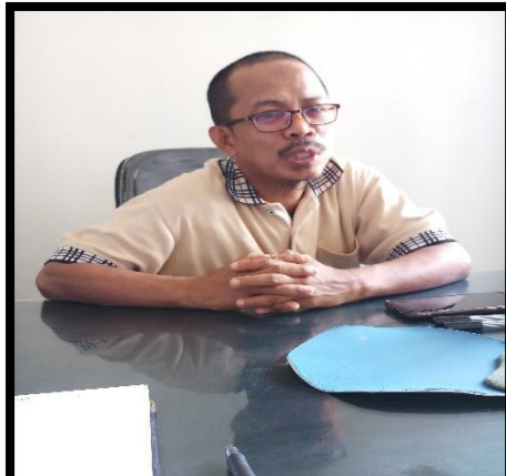
Wawancara dengan Kabid Pengelolaan Informasi Administrasi