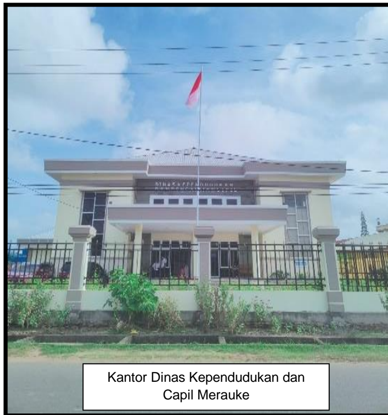
Kantor Dinas Kependudukan dan Capil Merauke