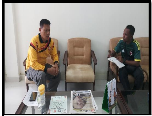
Wawancara dengan Sekretaris