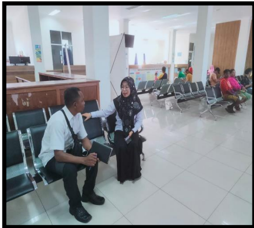
Wawancara dengan Kasubid