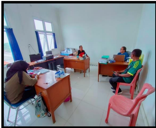
Wawancara dengan Staf