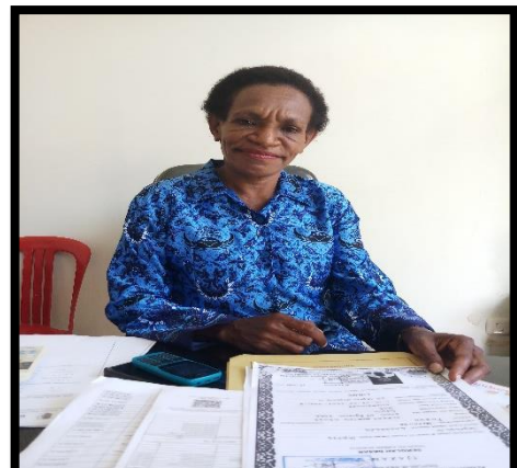
Wawancara dengan Kabid Pemanfaatan Data dan Inovasi