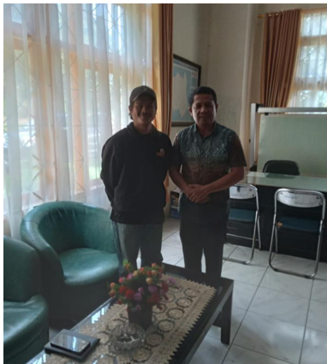
Wawancara Bersama PLT Kepala Dinas Sosial Kabupaten Luwu Utara