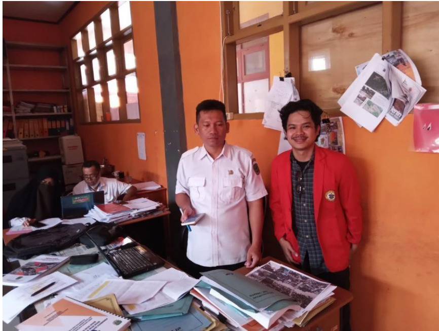
Wawancara Bersama Kepala Bidang Rehabilitasi Dan Rekonstruksi BPBD Kabupaten Luwu Utara