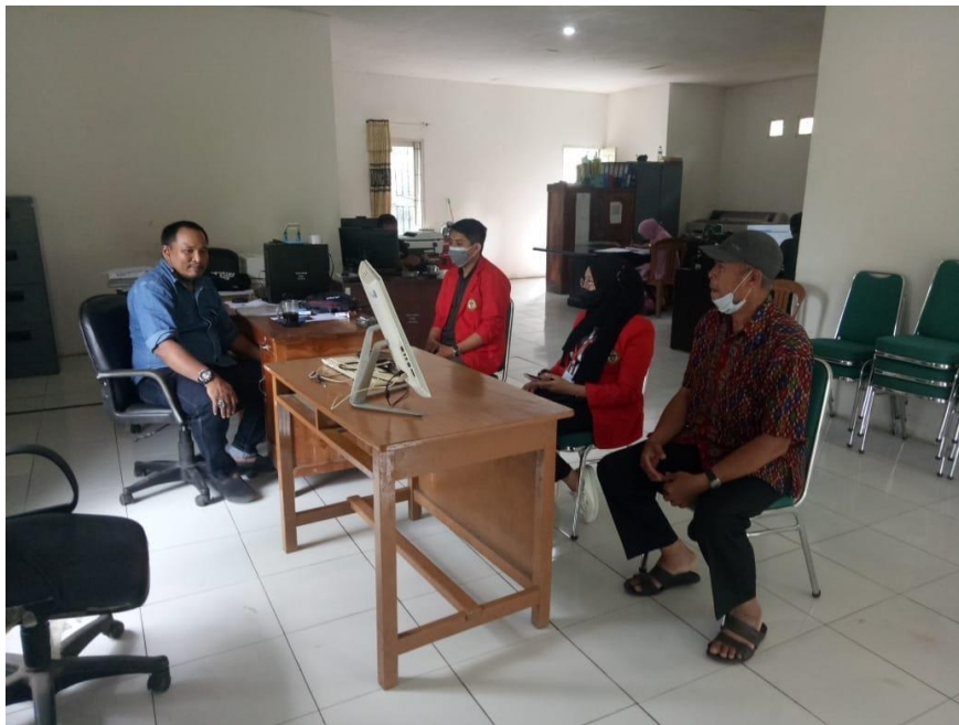
Wawancara Bersama Camat Baebunta dan Korban Banjir