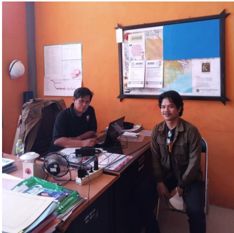
Wawancara Bersama Camat Masamba