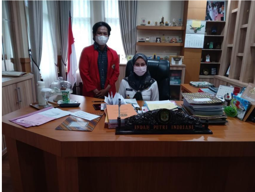
Wawancara Bersama Ibu Bupati Luwu Utara