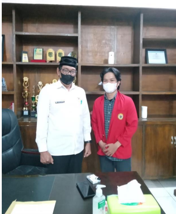
Wawancara Bersama Kepala Dinas PUPR Kabupaten Luwu Utara