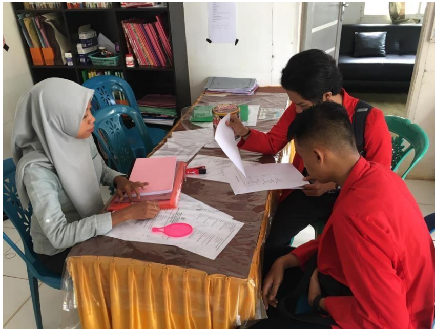
Wawancara Bersama Kepala Bidang Perumahan Dinas PUPR Kabupaten Luwu Utara