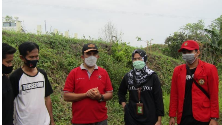
Wawancara Bersama Kepala Desa Radda dan Masyarakat Korban Banjir