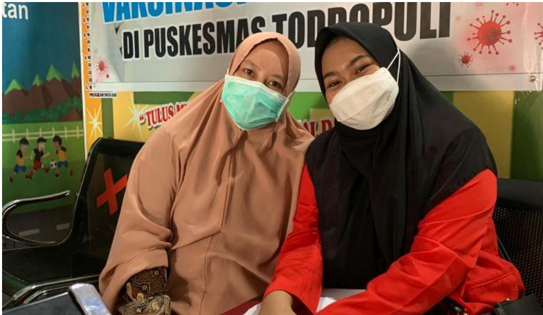
Wawancara pada tanggal 24 Maret 2022 dengan salah satu petugas Home Care Dottorotta Puskesmas Toddopuli Makassar