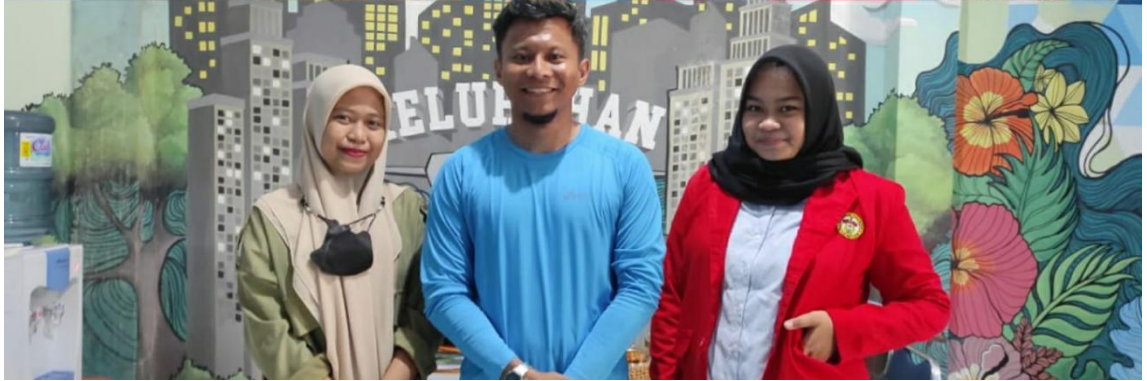
Wawancara pada tanggal 04 Juni 2022 dengan Lurah Kelurahan Paropo, Kec. Panukukang, Kota Makassar