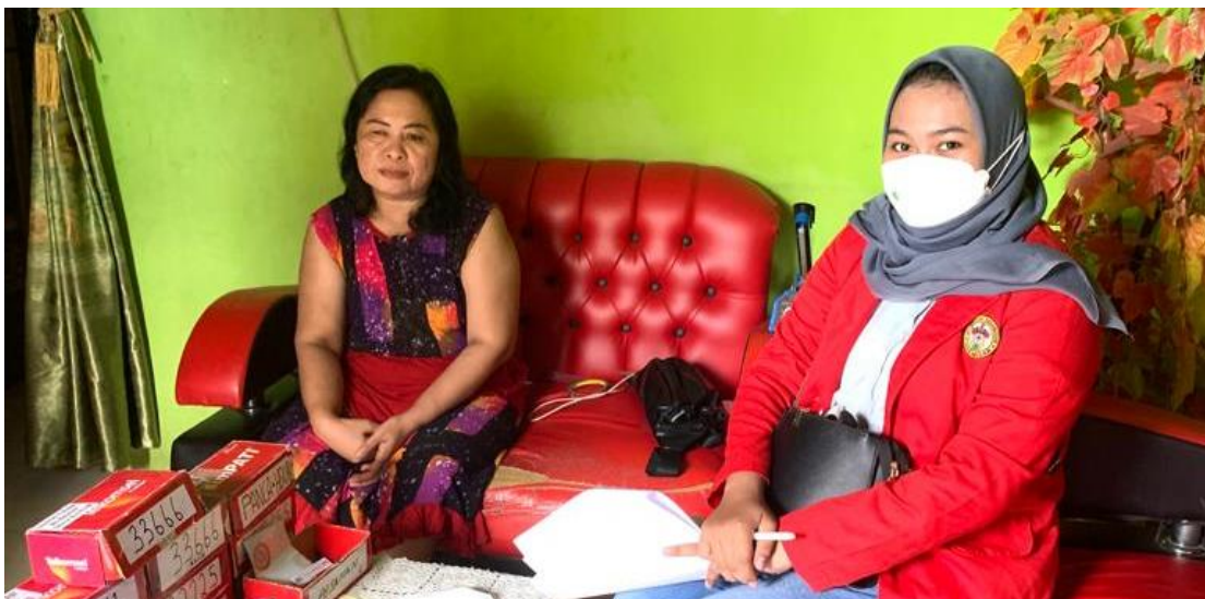
Wawancara pada tanggal 16 April 2022 dengan pengguna layanan program Home Care Dottorotta Puskesmas Toddopuli Makassar