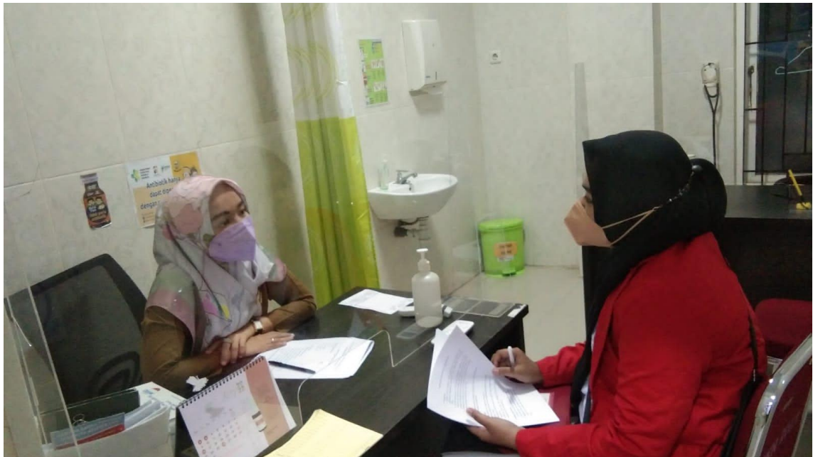
Wawancara pada tanggal 05 April 2022 dengan petugas Home Care Dottorotta Puskesmas Toddopuli Makassar