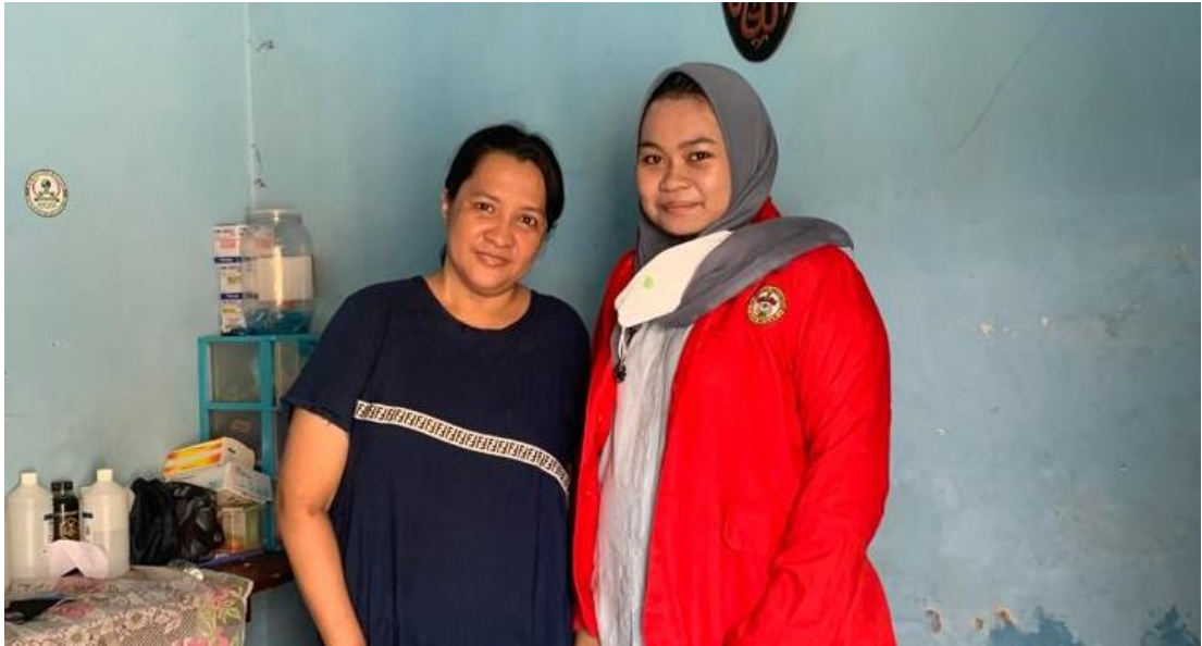
Wawancara pada tanggal 16 April 2022 dengan pengguna layanan program Home Care Dottorotta Puskesmas Toddopuli Makassar