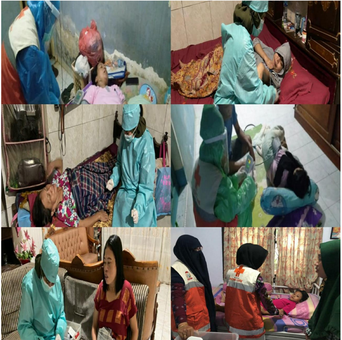
Petugas Puskesmas Toddopuli melayani Pasien Home Care