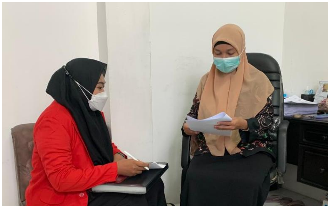
Wawancara pada tanggal 22 April 2022 dengan Kepala Seksi Pelayanan Kesehatan Primer Dinas Kesehatan Kota Makassar