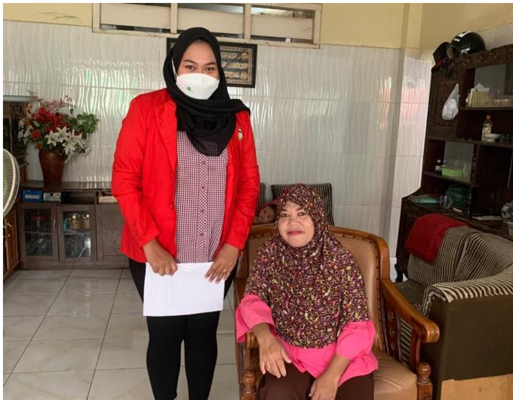
Wawancara pada tanggal 17 April 2022 dengan pengguna layanan program Home Care Dottorotta Puskesmas Toddopuli Makassar