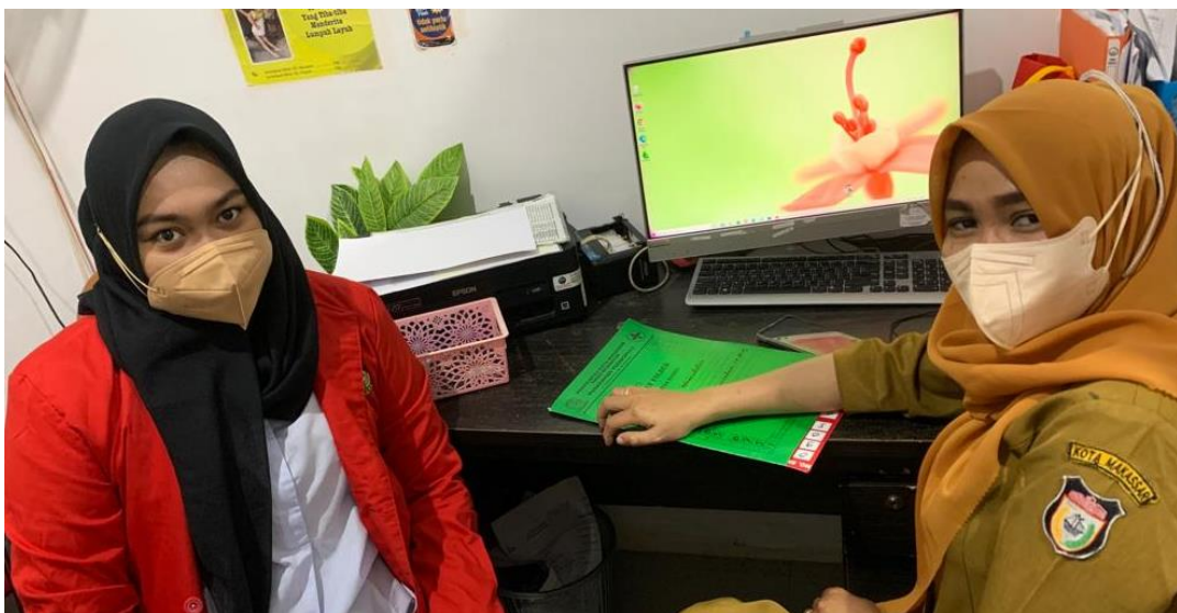
Wawancara pada tanggal 05 April 2022 dengan Pengelola/Penanggung jawab Home Care Dottorotta Puskesmas Toddopuli Makassar