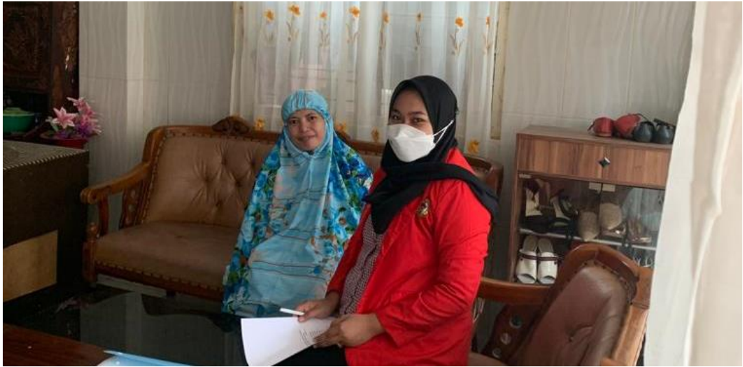
Wawancara pada tanggal 17 April 2022 dengan pengguna layanan program Home Care Dottorotta Puskesmas Toddopuli Makassar