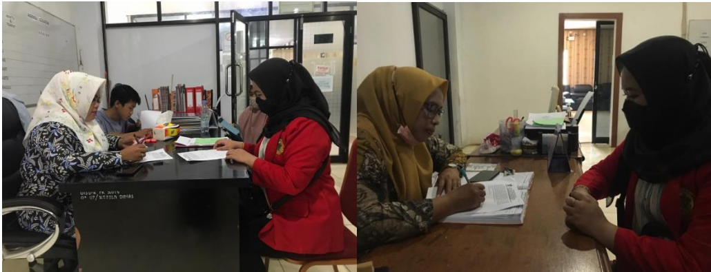
(Foto bersama dengan Pegawai Bidang Kesekretariatan, 02 Maret 2022)