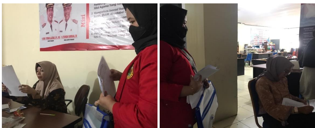
(Foto bersama dengan Pegawai Bidang Pendidikan Anak Usia Dini dan Non Formal, 04 Maret 2022)