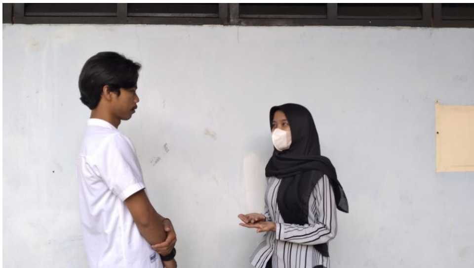
Dokumentasi wawancara dengan Masyarakat Pengguna LAPOR