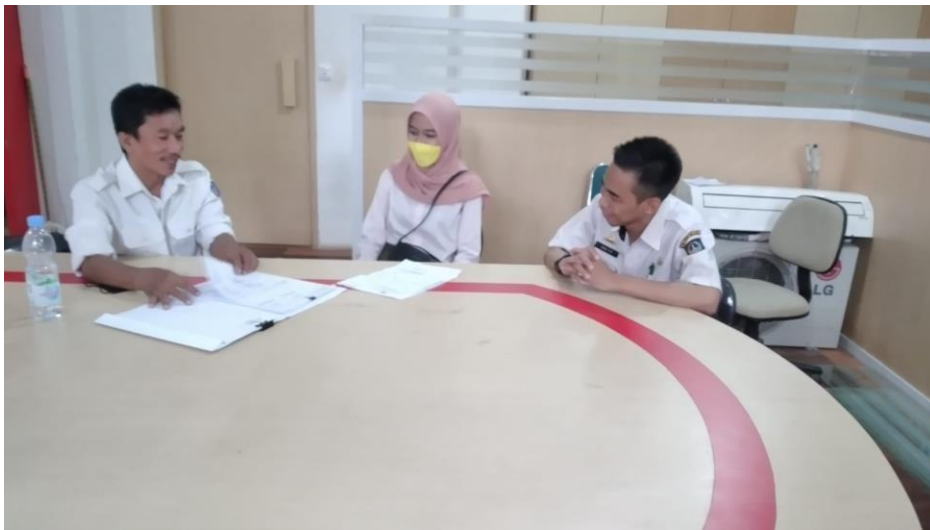
Dokumentasi wawancara dengan Admin Super LAPOR Sulsel