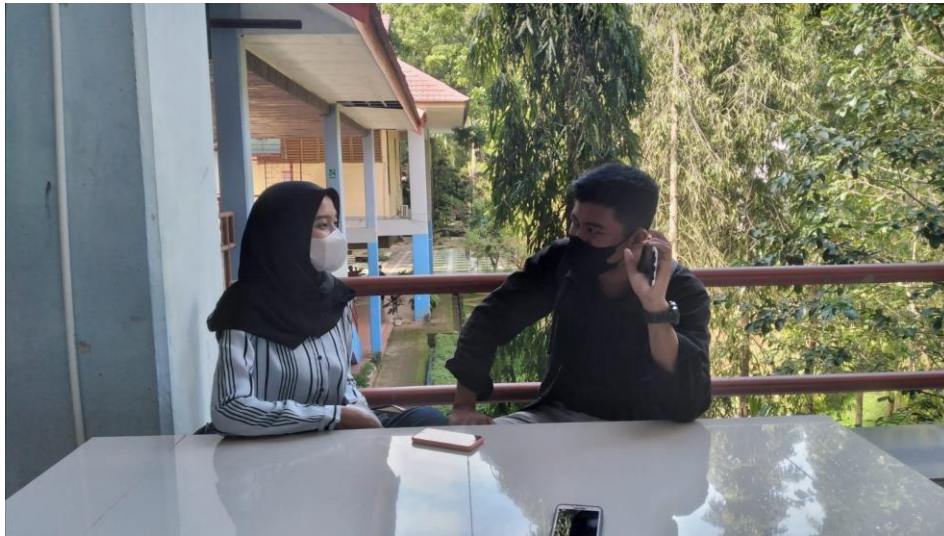
Dokumentasi wawancara dengan Masyarakat Pengguna LAPOR