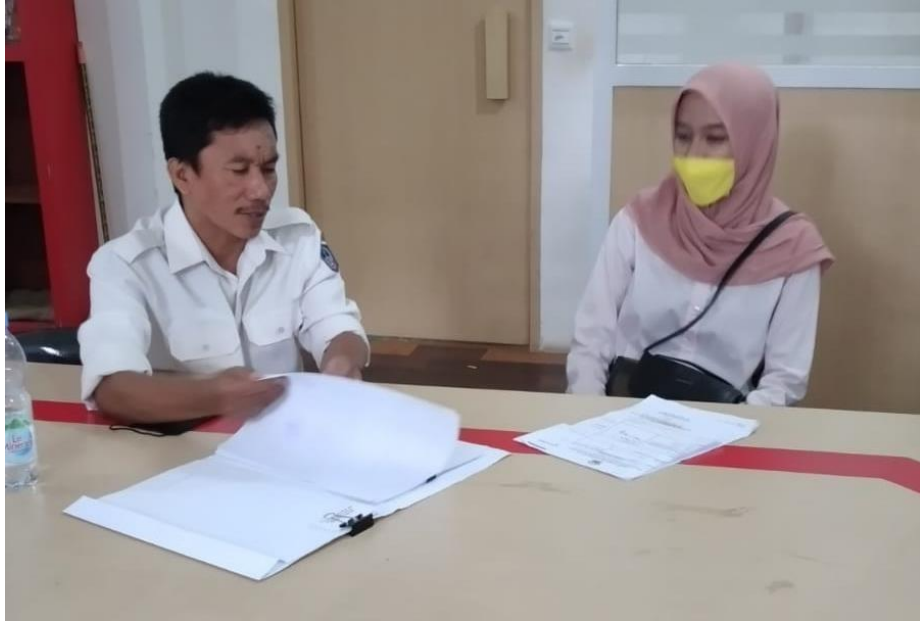
Dokumentasi wawancara dengan Seksi Pelayanan Publik