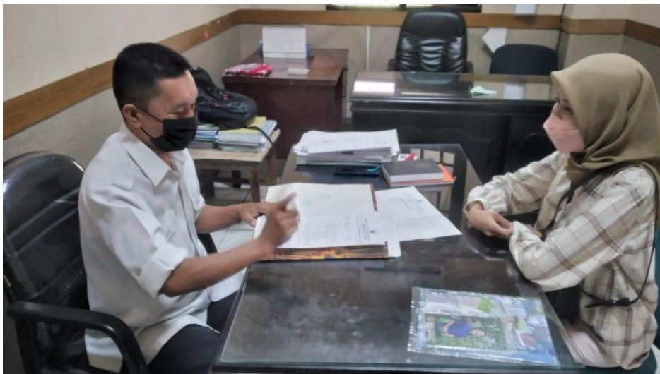
Dokumentasi wawancara dengan Kepala bidang Humas IKP