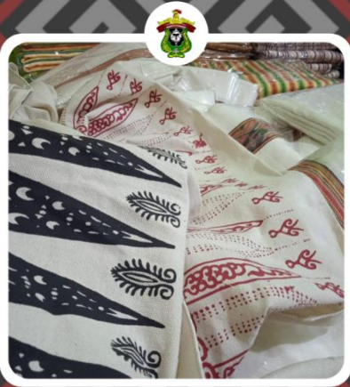
Inovasi Pengembangan Pariwisata Melalui Local Branding Product di Kabupaten Toraja Utara