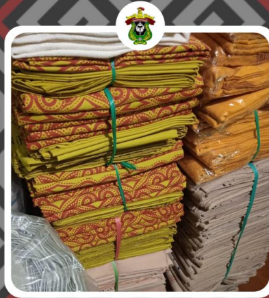
Inovasi Pengembangan Pariwisata Melalui Local Branding Product di Kabupaten Toraja Utara