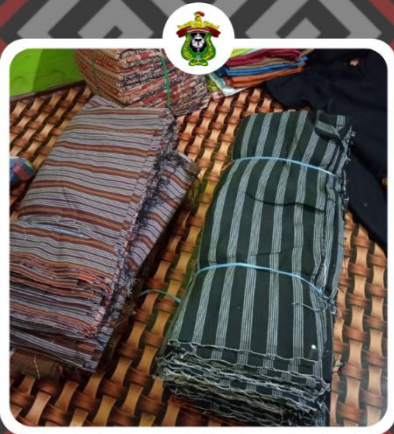
Inovasi Pengembangan Pariwisata Melalui Local Branding Product di Kabupaten Toraja Utara