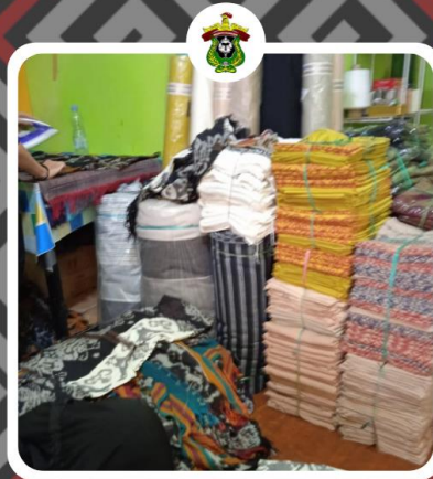
Inovasi Pengembangan Pariwisata Melalui Local Branding Product di Kabupaten Toraja Utara