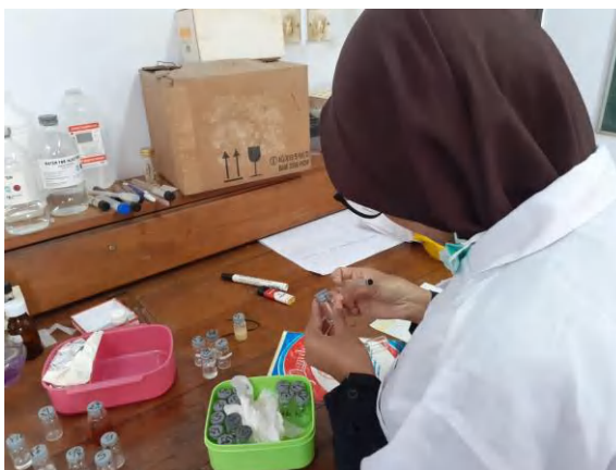
Lampiran 24. Persiapan sebelum melakukan pengenceran