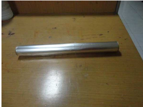
Lampiran 13. Aluminium Foil