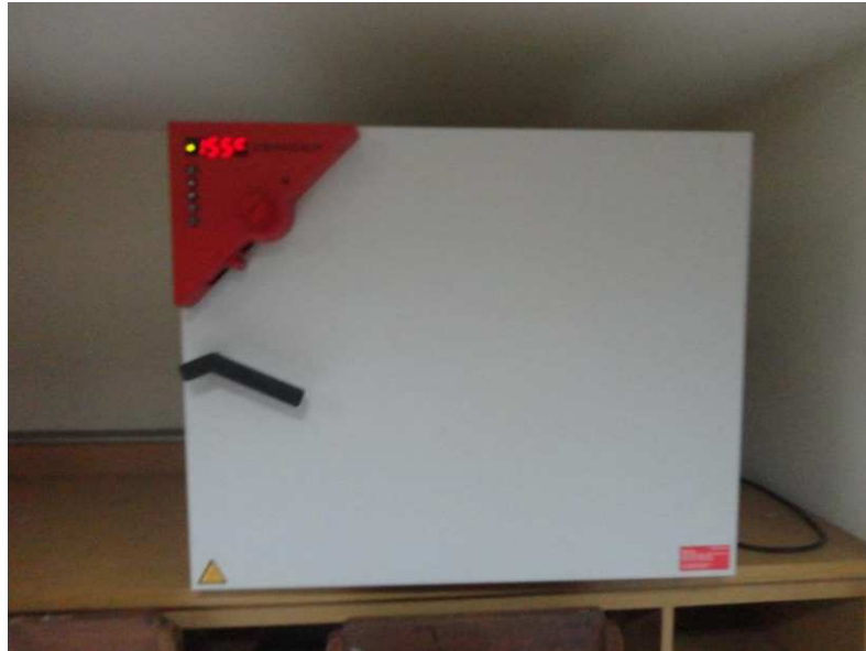
Lampiran 8. Oven