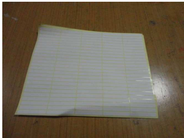
Lampiran 15. Label