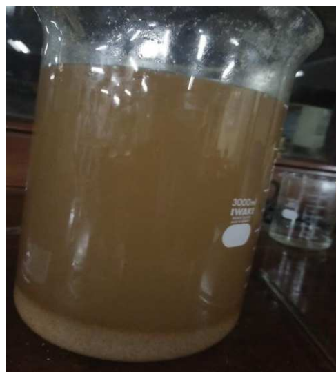
Lampiran 21. Penjernihan Kitosan