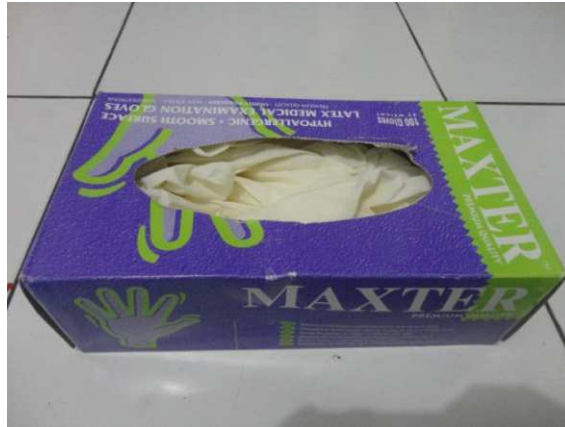
Lampiran 19. Handschoen