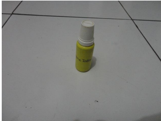
Lampiran 16. Povidine Iodine