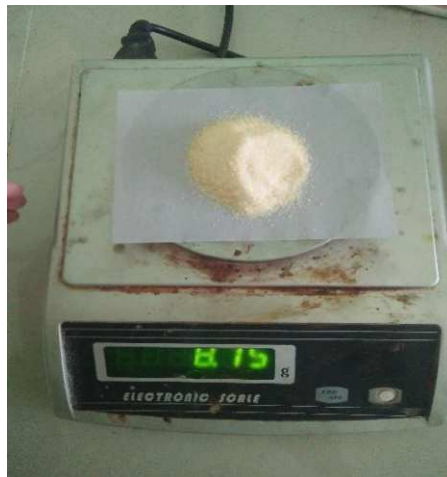
Lampiran 2. Gelatin