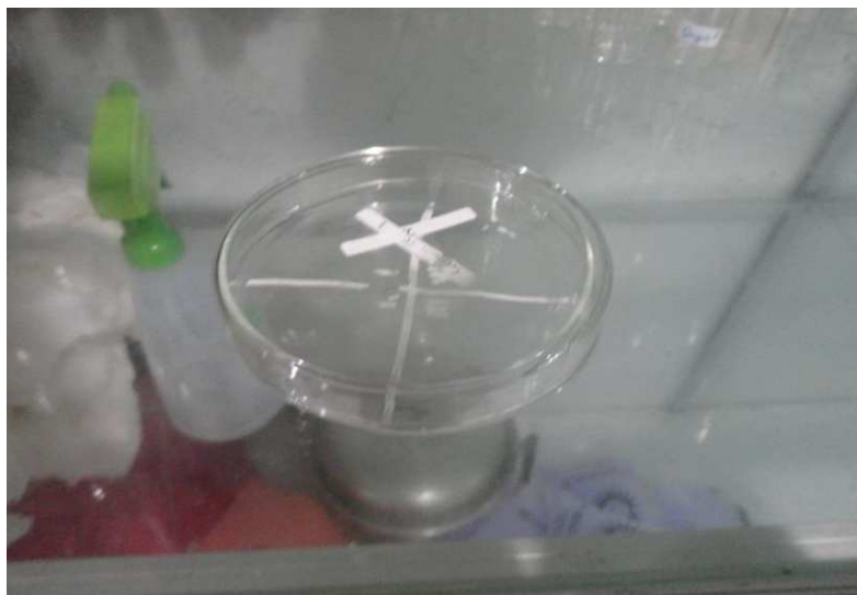
Lampiran 7. Cawan Petri