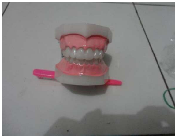
Lampiran 17. Model Gigi