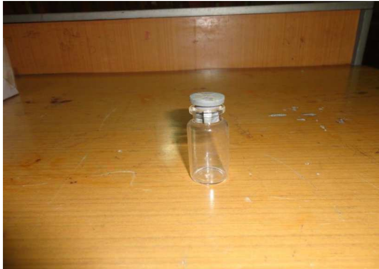
Lampiran 6. Botol Vial