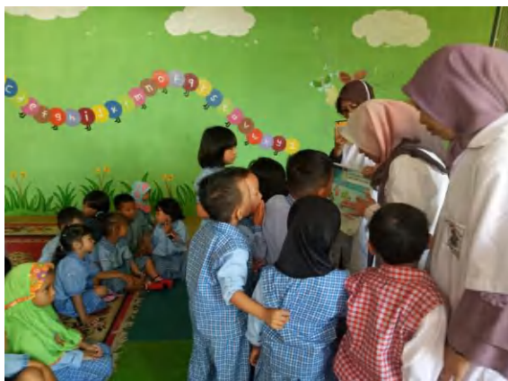
Lampiran 23. Penyuluhan Cara menyikat gigi yang benar