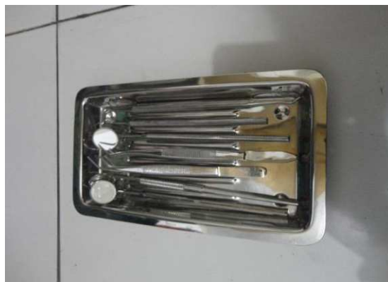
Lampiran 18. Oral Diagnostic dan Tray Sekat