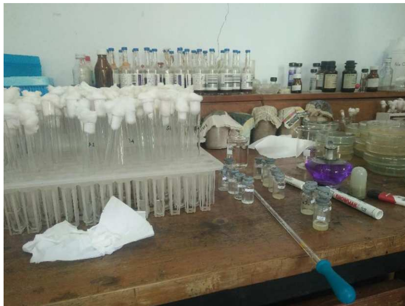
Lampiran 5. Alat dan Bahan Pengenceran