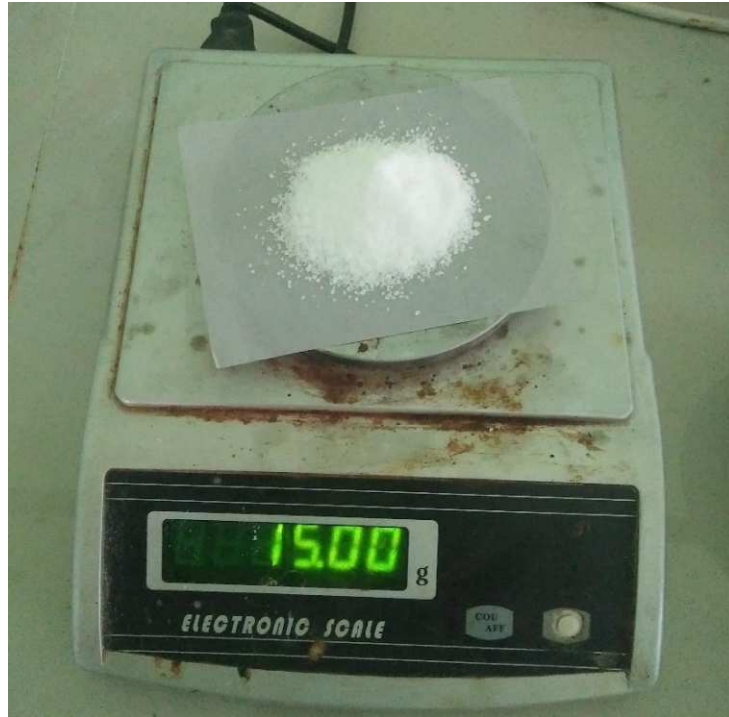
Lampiran 4. Gula Xylitol