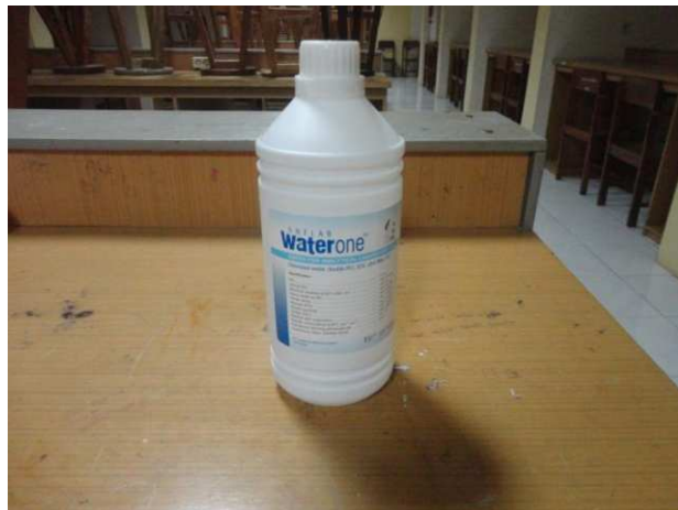
Lampiran 11 Aquadest