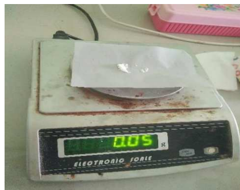
Lampiran 3. Metil Paraben