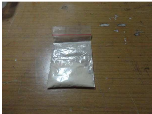
Lampiran 12. Kitosan dari Kulit Udang Putih ( Litopenaeus vannamei )