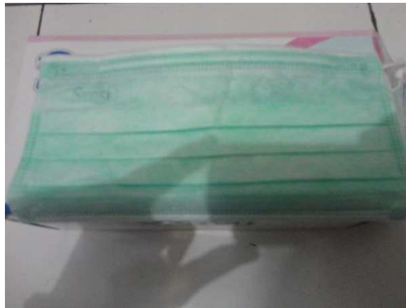
Lampiran 20. Masker