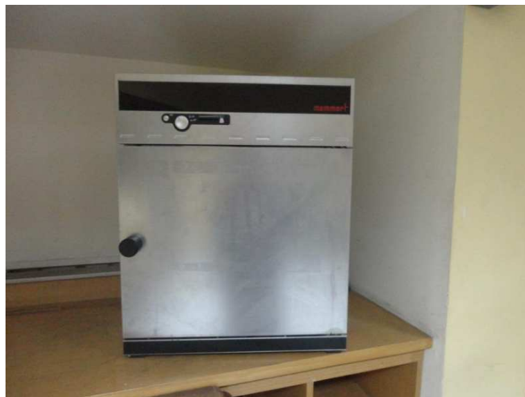
Lampiran 9. Inkubator