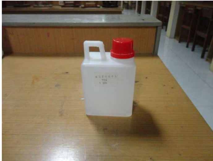
Lampiran 10. Alkohol 70%