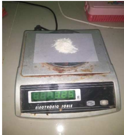
Lampiran 1. Kitosan Kulit Udang Putih ( Litopenaeus vannamei )