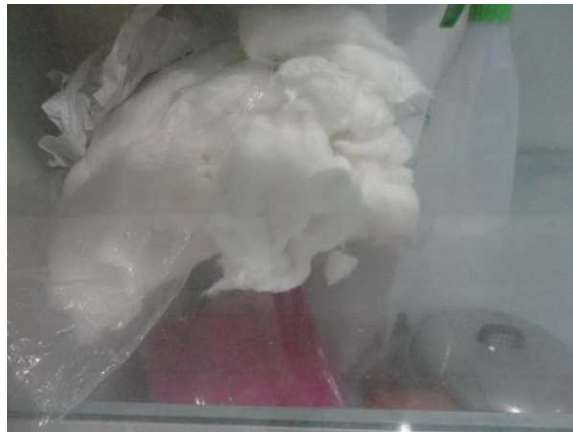
Lampiran 14. Kapas