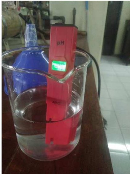
Lampiran 22. Perhitungan pH menggunakan pH meter