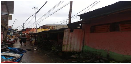
Situasi Permukiman Kelurahan Tamalabba

Memperlihatkan situasi permukiman Tamalabba dimana pada gambar ini merupakan rumah tinggal yang masih asli, hanya dinding dan atapnya yang sudah diganti karena sudah lapuk.