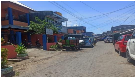
Situasi Depan Kantor Lurah Tabaringan

Memperlihatkan situasi permukiman rumah dinas Tabaringan Luar Kelurahan Totaka yang dibangun sekitar tahun 1962.