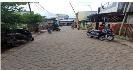
Situasi Permukiman Kelurahan Tabaringan

Memperlihatkan situasi permukiman depan Kantor Kelurahan Tabaringan, tidak jauh dari lokasi ini ada pasar Tabaringan