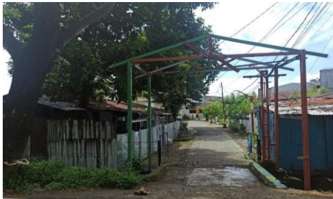
Situasi Permukiman Rumah Dinas Tabaringan Luar Kelurahan Totaka

Memperlihatkan situasi permukiman Tamalabba dimana pada gambar ini merupakan rumah tinggal yang masih asli, hanya dinding dan atapnya yang sudah diganti karena sudah lapuk.