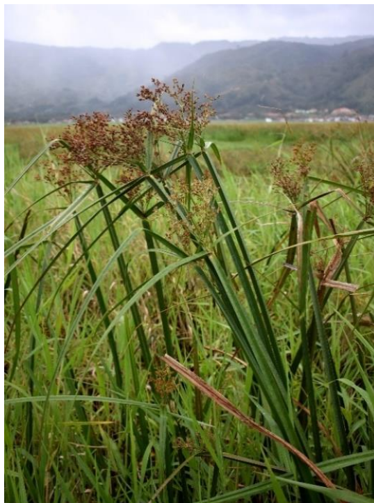
Gambar 2. Tumbuhan Scirpus Grossus

Taksonomi tumbuhan Scirpus Grossus atau dikenal sebagai tanaman mensiang dapat dilihat pada Gambar 4.