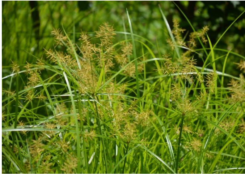
Gambar 1. Tumbuhan Cyperus Rotundus

Kingdom : plantae Subkingdom : Tracheobionta , Super Divisi : Spermatophyta Divisi : Magnoliophyta Kelas : Liliopsida Sub kelas : Commelinidae Ordo : Cyperales Famili : Cyperaceae Genus : Cyperus Spesies : Cyperus Rotundus L. (Amalia, 2013)