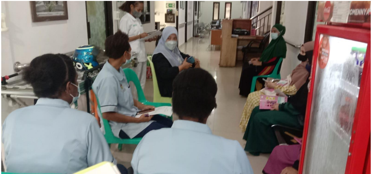
Bimbingan dengan ketua prodi di puskesmas Tamalanrea Jaya