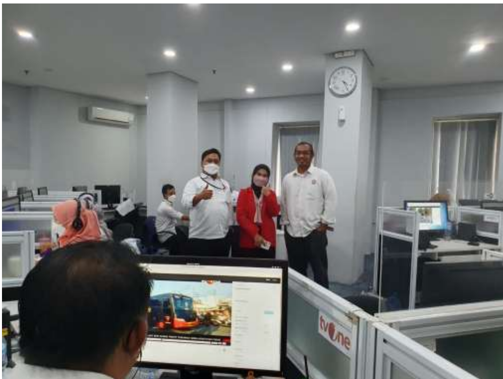
Gambar 4: Ruang Pemantauan langsung isi siaran