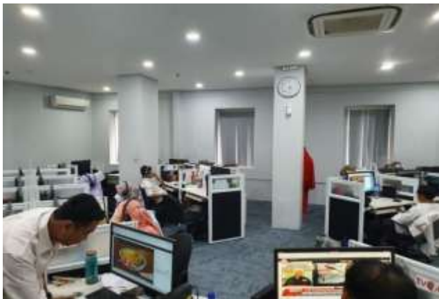
Gambar 5: Proses kegiatan pemantauan/monitoring langsung isi siaran KPI Pusat