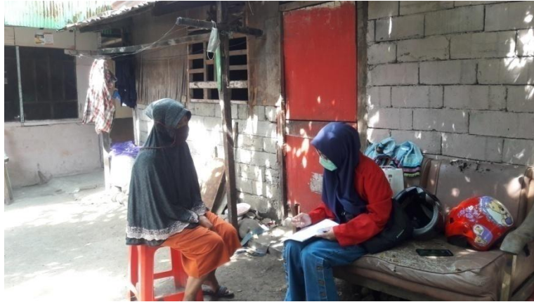
Wawancara Kader Posyandu di Kampung KB Kecamatan Panakkukang Kelurahan Karuwisi