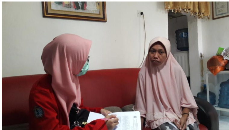
Wawancara Kader Posyandu di Kampung KB Kecamatan Tallo Kelurahan Pannampu