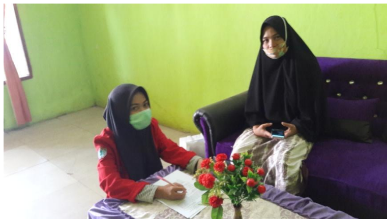
Wawancara Kader Posyandu di Kampung KB Kecamatan Biringkanaya Kelurahan Untia