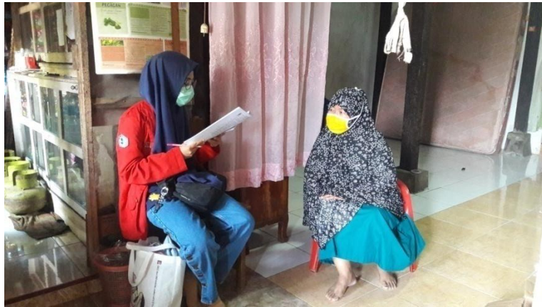
Wawancara Kader Posyandu di Kampung KB Kecamatan Ujung Pandang Kelurahan Pisang Selatan