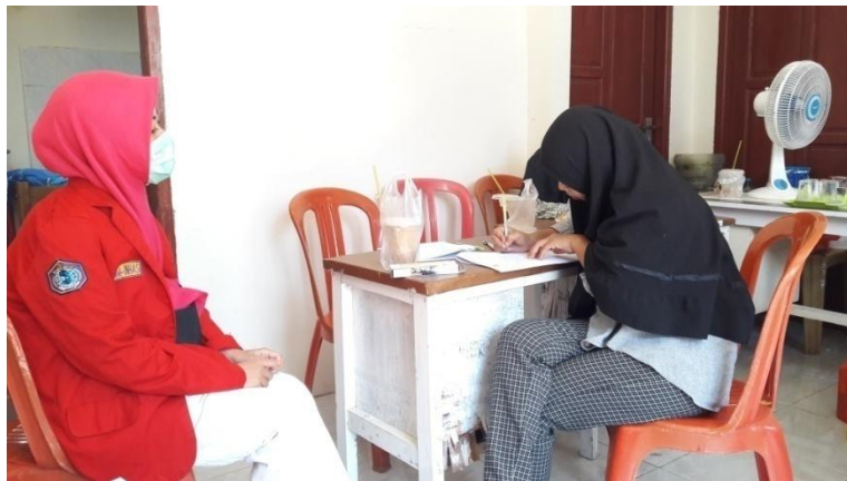
Wawancara Kader Posyandu di Kampung KB Kecamatan Bontoala Kelurahan Layang