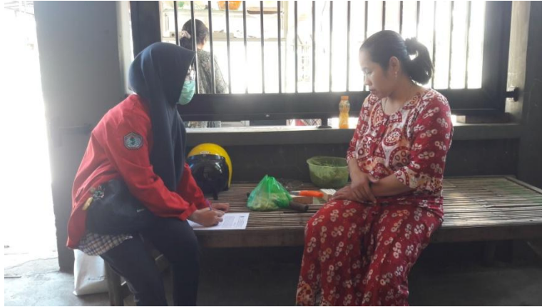
Wawancara Kader Posyandu di Kampung KB Kecamatan Tamalanrea Kelurahan Kapasa Raya