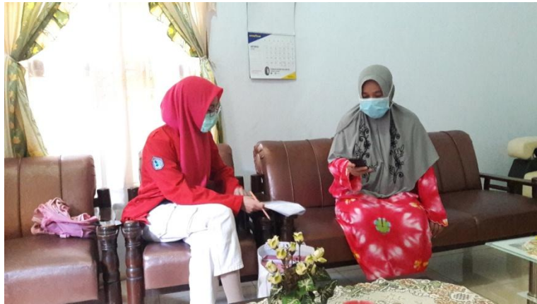
Wawancara Kader Posyandu di Kampung KB Kecamatan Wajo Kelurahan Melayu