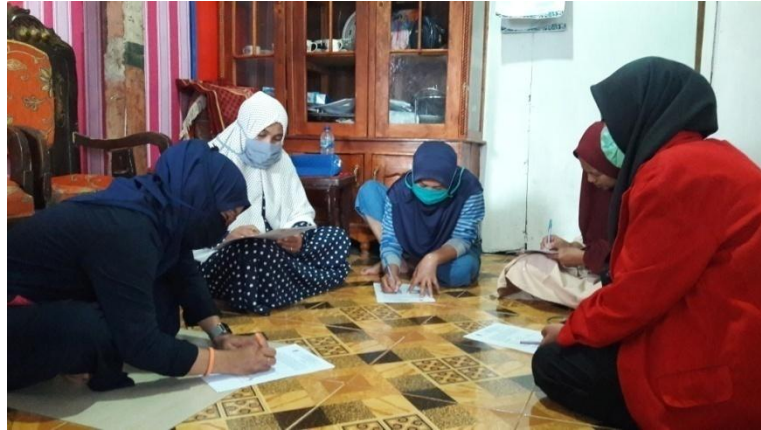
Wawancara Kader Posyandu di Kampung KB Kecamatan Biringkanaya Kelurahan Pai