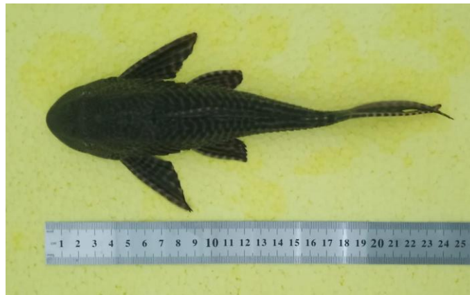
Gambar 1. Ikan sapu-sapu ( Pterygoplichthys pardalis )

Ikan sapu-sapu telah teridentifikasi memiliki 19 spesies dari marga Pterygoplichthys di dunia. Di Indonesia terdapat 5 spesies yang telah ditemukan yang sebelumnya hanya terdapat 2 spesies. Adapun jenis ikan sapu-sapu yang ditemukan yaitu P. disjunctivus dan P. pardalis (Elfidasari et al. , 2016) yang kemudian ditambahkan oleh Haryono et al. (2017) yaitu P. anisitsi , P. gibbiceps dan P. multiradiatus (Wahyudewantoro, 2018). Salah satu spesies ikan sapu-sapu yang ada di Indonesia yaitu jenis ikan sapu-sapu Pterygoplichthys pardalis (Gambar 1).