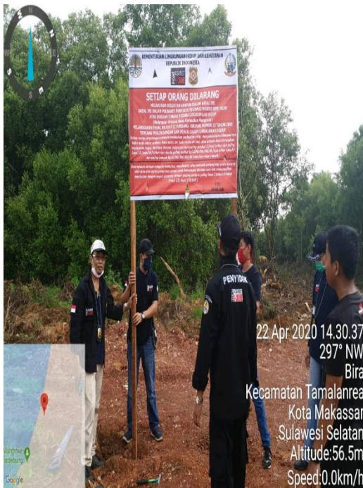
Pihak Gakkum Saat Melakukan Penyidikan