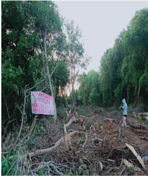
Kawasan Hutan Mangrove Yang Dirusak