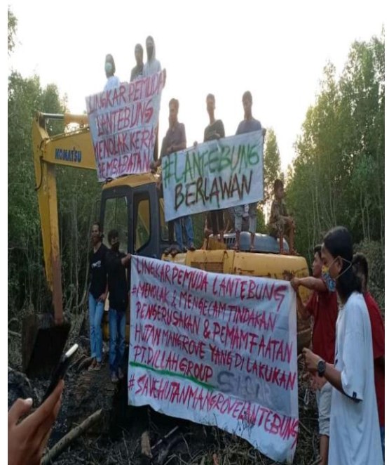
Kelompok Pemuda Yang Melakukan Demonstrasi