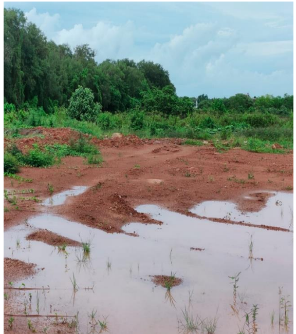
Terdapat Lahan Terbuka Yang Saat Ini Sedang Ditimbun