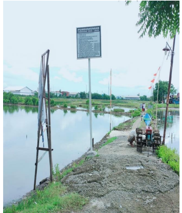
Terdapat Banyak Tanda Palang Kepemilikan