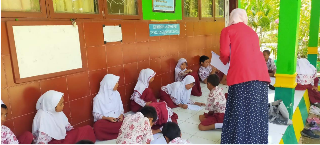
Gambar 16. Post Test I di SDN 431 Walenna