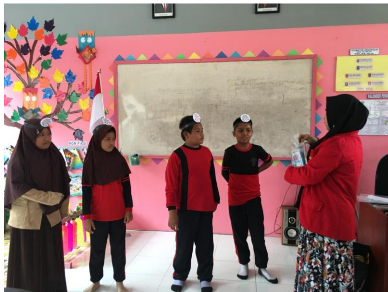
Gambar 15. Pemberiann Reward kepada siswa/siswi yang dapat menjawab pertanyaan di SDN 29 Bajo