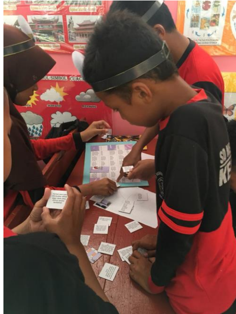
Gambar 11. Bermain Puzzle Bahaya Merokok di SDN 29 Bajo