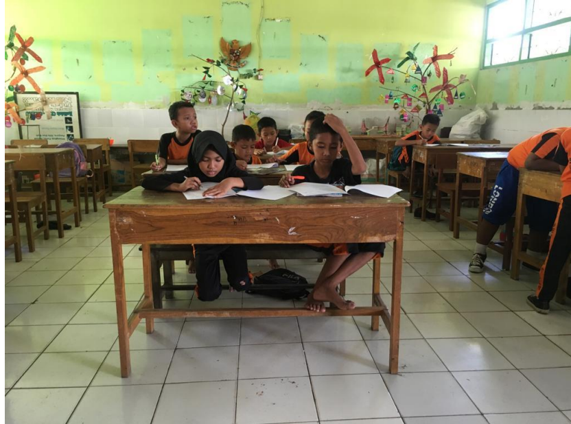
Gambar 1. Uji Coba Kuesioner di SD Inpres Kera-Kera