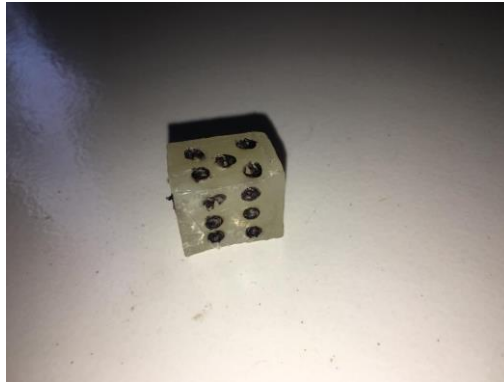
Gambar dadu ular tangga