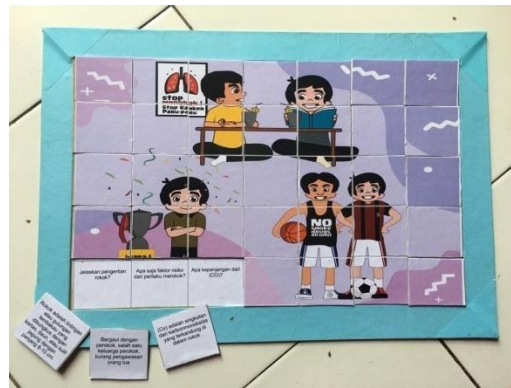
Gambar kepingan puzzle