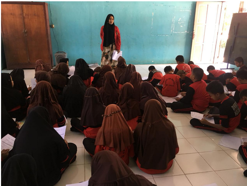
Gambar 17. Post Test I di SDN 29 Bajo