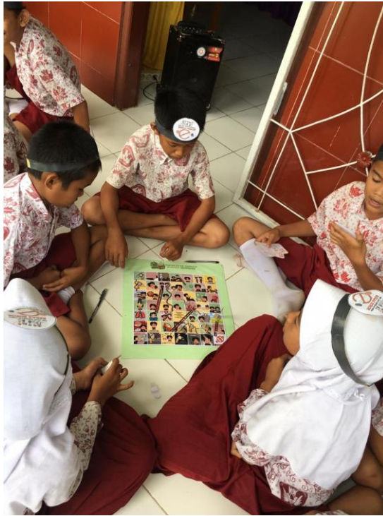
Gambar 10. Bermain Ular Tangga Bahaya Merokok di SDN 431 Walenna