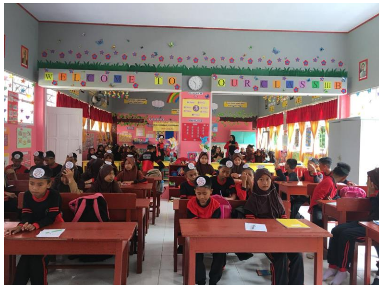
Gambar 9. Pembagian Kelompok di SDN 29 Bajo