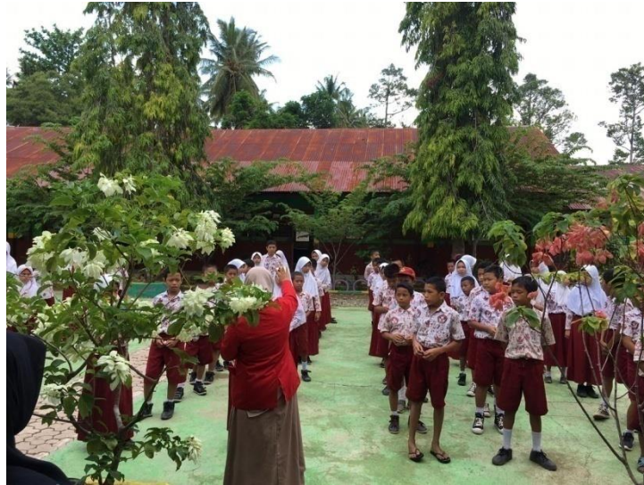
Gambar 4. Pengambilan Nomor dengan sistem Random Sampling di SDN 431 Walenna