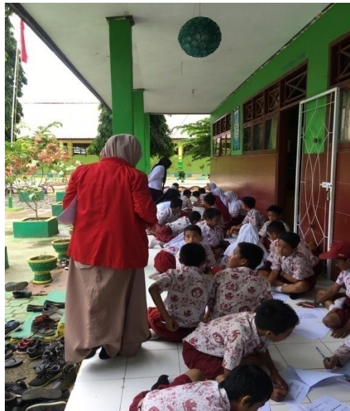
Gambar 6. Pre Test di SDN 431 Walenna