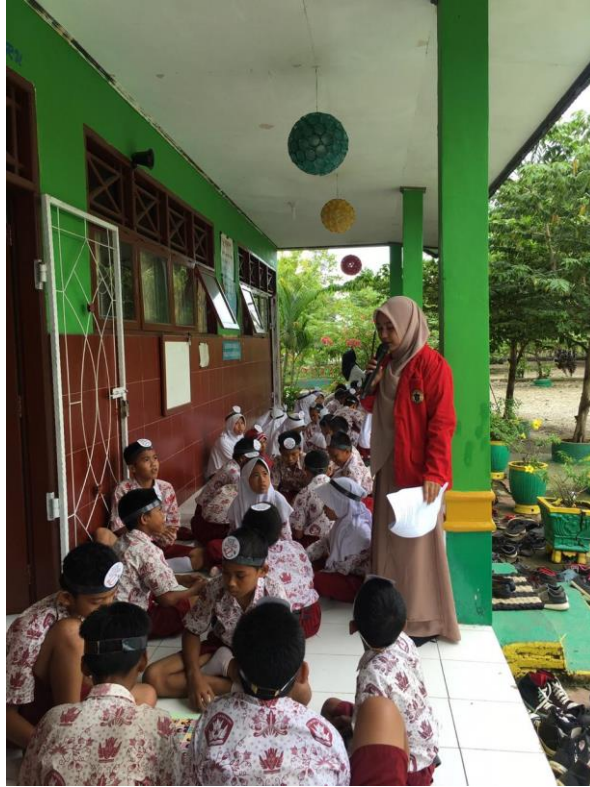
Gambar 12. Sesi Tanya Jawab Tentang Bahaya Merokok di SDN 431 Walenna