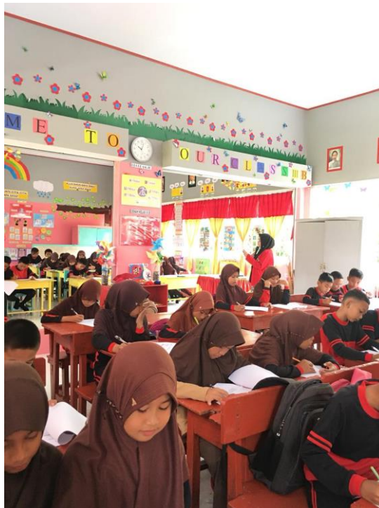
Gambar 7. Pre Test di SDN 29 Bajo