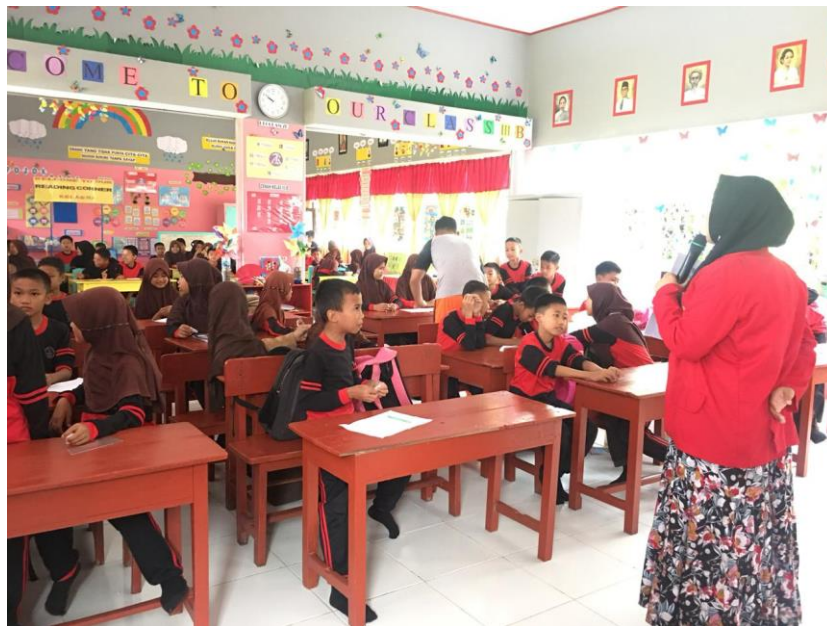
Gambar 5. Pengambilan Nomor dengan sistem Random Sampling di SDN 29 Bajo