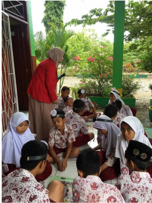
Gambar 8. Pembagian Kelompok di SDN 431 Walenna