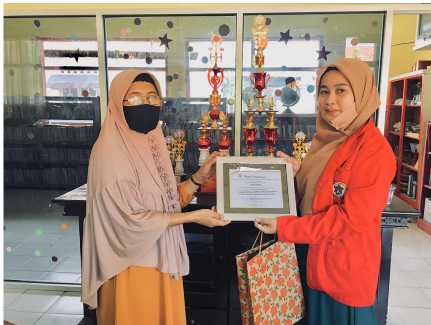
Gambar 19. Penyerahan Plakat di SDN 29 Bajo