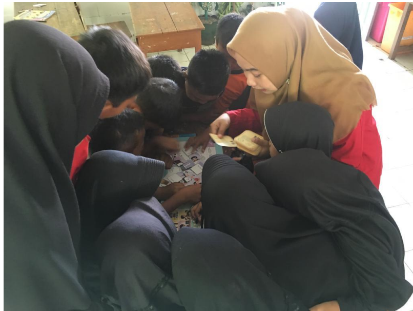
Gambar 2. Memperlihatkan Media Edukasi Ular Tangga dan Puzzle di SD Inpres Kera kera