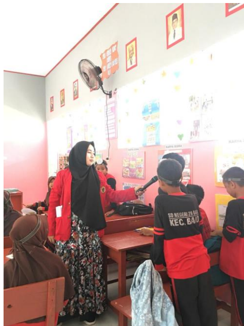
Gambar 13. Sesi Tanya Jawab Tentang Bahaya Merokok di SDN 29 Bajo