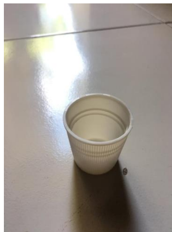
Gambar pengocok dadu ular tangga

Berikut contoh pengocok dadu yang digunakan dalam permainan ini: