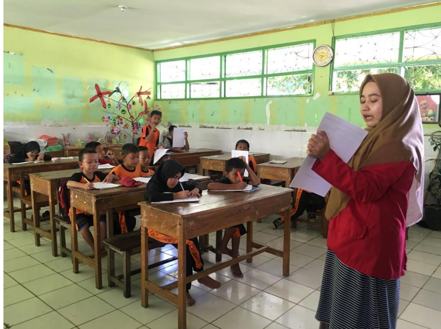
Gambar 3. Uji Coba Media di SD Inpres Kera-Kera