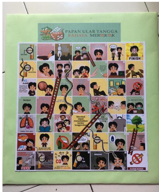
Gambar beberan ular tangga

Beberan ini berukuran 5 cm x 5 cm yang ditempelkan pada kertas karton tebal sebagai arena bermain, dimana dalam permainan ini yang menjadi pemain adalah sebuah bidak yang bergambarkan karakter yang ada pada ular tangga tersebut. Beberan ini merupakan hasil desain oleh Asrianti Asmul Syam. Berikut gambar miniatur dari beberan yang dimaksud: