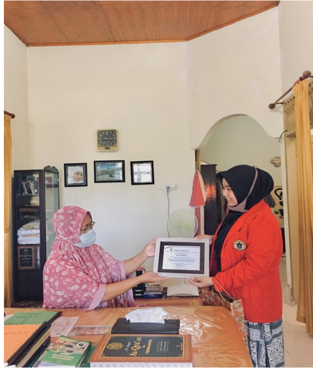
Gambar 18. Penyerahan Plakat di Rumah Ibu Kepala Sekolah SDN 431 Walenna