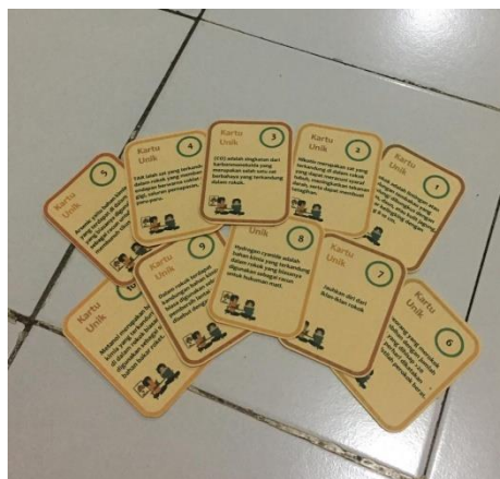
Gambar kartu unik

Kartu unik yang digunakan pada penelitian ini terdiri dari beberapa informasi, yang terdiri dari 49 kartu yang disesuaikan dengan jumlah kotak yang ada pada ular tangga bahaaya merokok, adapun kartu unik yang dimaksud ialah: