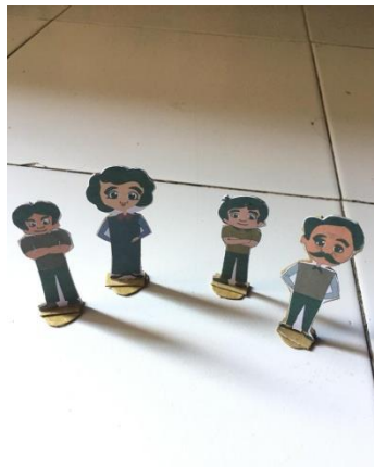
Gambar bidak ular tangga

Berikut contoh bidak yang di maksud dalam permainan ini: