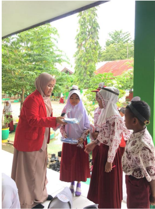
Gambar 14. Pemberiann Reward kepada siswa/siswi yang dapat menjawab pertanyaan di SDN 431 Walenna