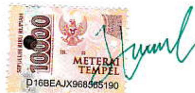
Husnul Fahimah Ilyas