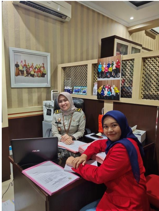
Wawancara bersama ibu kepala subseksi pemeliharaan data dan pembinaan PPAT