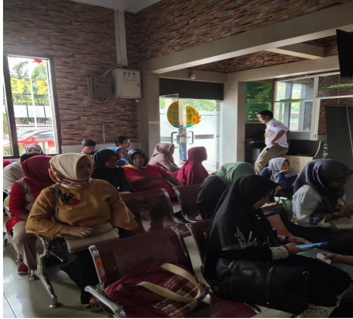
Masyarakat yang datang mengantri