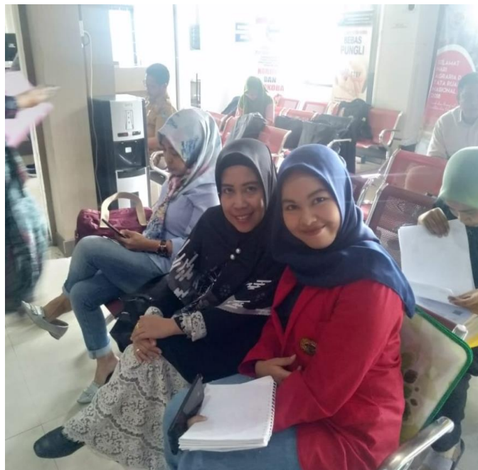
Wawancara bersama masyarakat