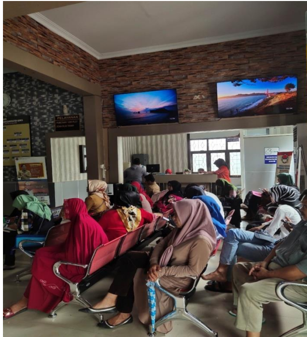
Masyarakat yang datang untuk mengurus sertifikat tanah