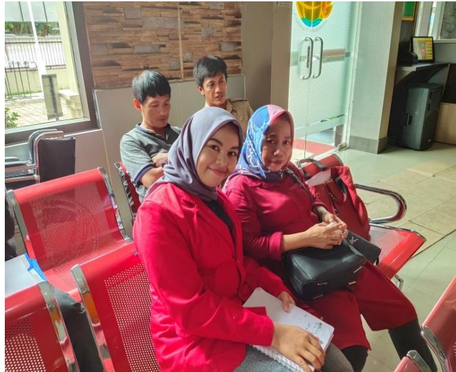
Wawancara bersama masyarakat