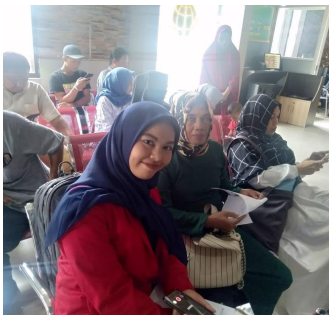
Wawancara bersama masyarakat