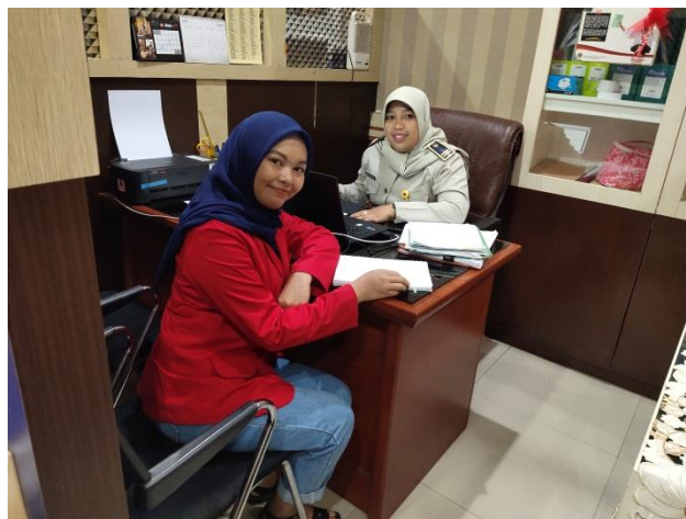
Wawancara bersama pegawai kantor pertanahan kasubsi penetapan hak tanah dan pemberdayaan