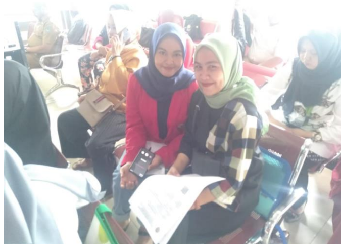
Wawancara bersama masyarakat