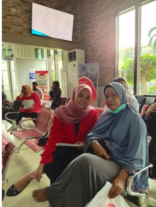
Wawancara bersama masyarakat