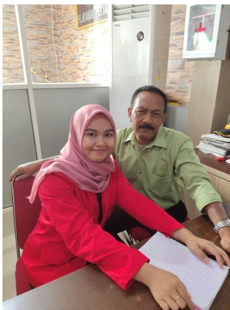
Wawancara bersama pegawai bagian loket informasi