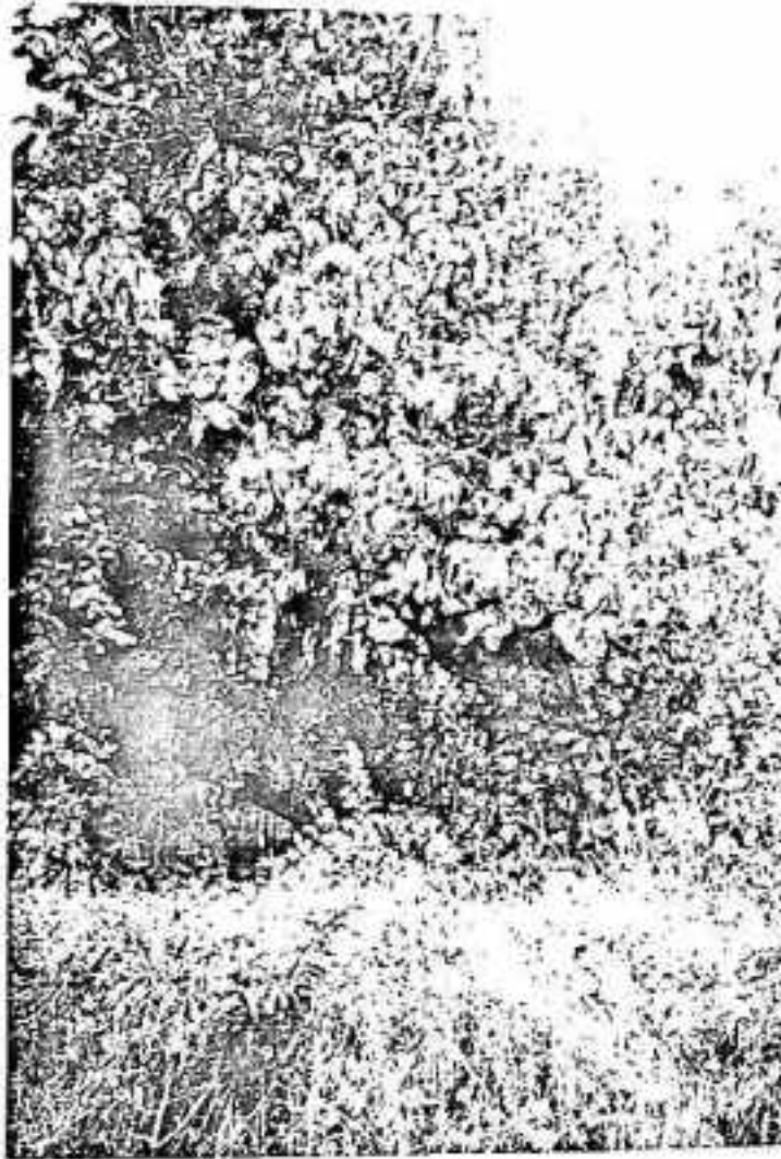
Gambar 2 : Tumbuhan kayu Paliasa ( Kleinhovia hospita Linn.)