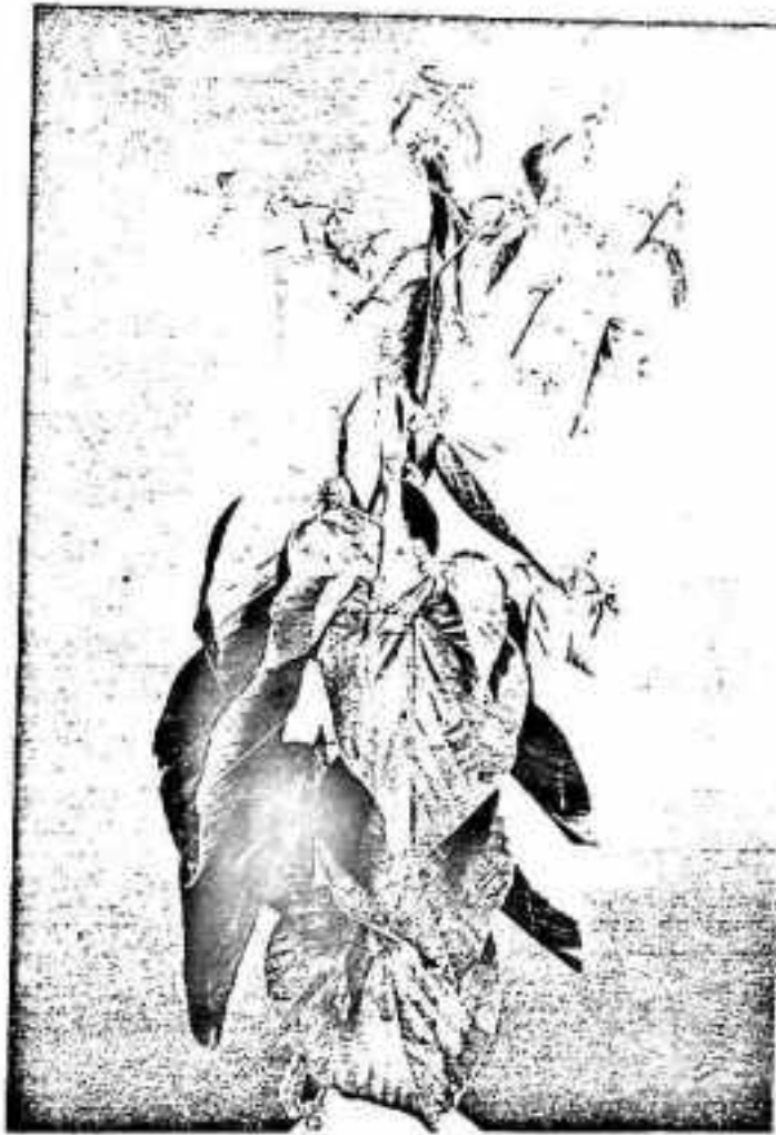
- Gambar 3 : Daun kayu paliasa