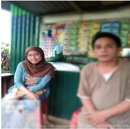
Gambar 8. Berfoto bersama setelah wawancara dengan Tokoh masyarakat Pulau Lakkang