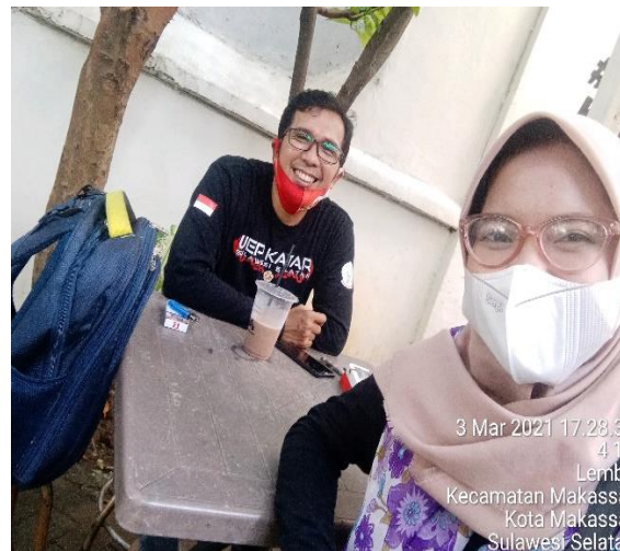
Gambar 7. Berfoto bersama setelah wawancara dengan PPK Kec. Tallo Kota Makassar