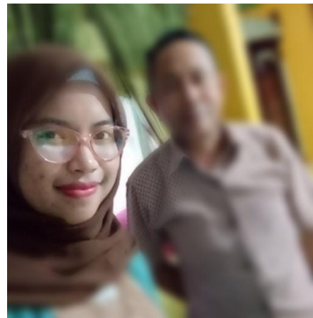
Gambar 5. Berfoto bersama setelah wawancara dengan Tim Sukses Aktor Partai Nasdem di Pulau Lakkang