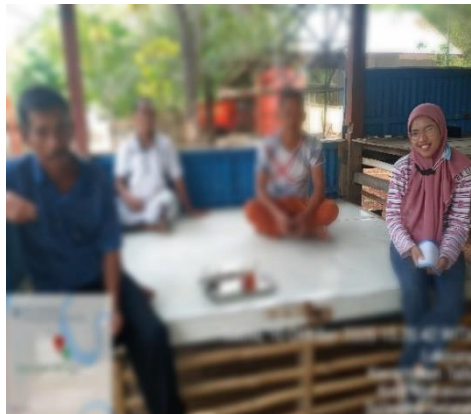
Gambar 10. Berfoto bersama setelah wawancara dengan masyarakat Pulau Lakkang