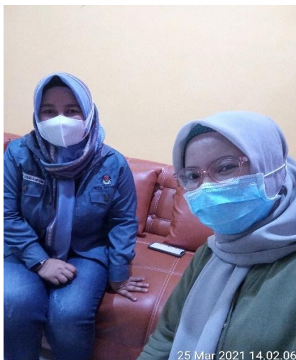
Gambar 6. Berfoto bersama setelah wawancara dengan Komisioner KPU Kota Makassar