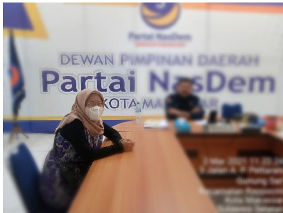
Gambar 4. Berfoto bersama setelah wawancara dengan Pengurus DPD Partai Nasdem Kota Makassar