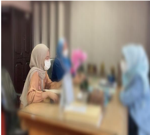
Gambar 1. Wawancara dengan Pengurus DPD Partai Nasdem Kota Makassar