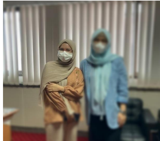
Gambar 2. Berfoto bersama setelah wawancara dengan Pengurus DPD Partai Nasdem Kota Makassar