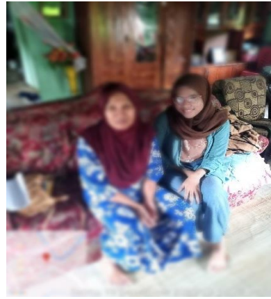
Gambar 9. Berfoto bersama setelah wawancara dengan masyarakat Pulau Lakkang