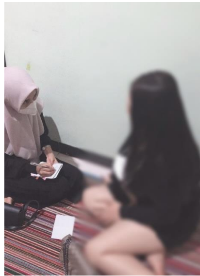
Gambar 7. Wawancara dengan pelaku prostitusi online di Kota Makassar