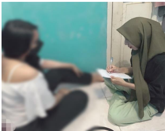
Gambar 8. Wawancara dengan pelaku prostitusi online di Kota Makassar