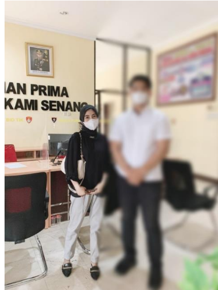
Gambar 2. Berfoto bersama setelah Selesai melakukan yang kedua dengan kepolisian Poldri Kota Makassar