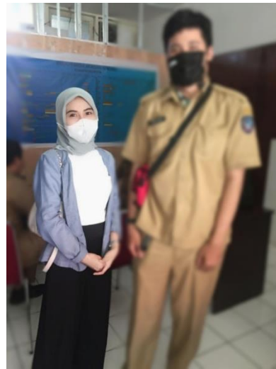
Gambar 4. Berfoto bersama dengan informan kedua setelah melakukan wawancara di Dinas Sosial Kota Makassar