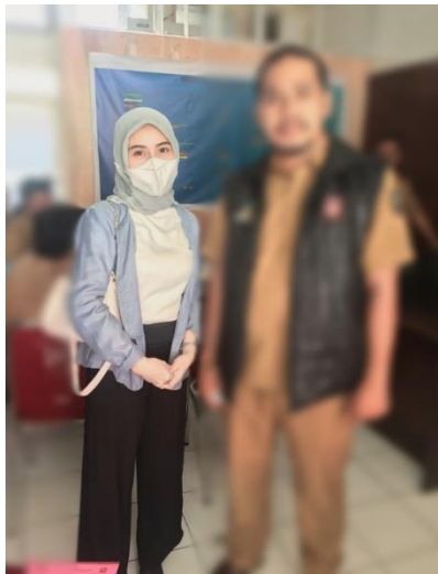
Gambar 3. Berfoto bersama Setelah wawancara dengan Informan di Dinas Sosial Kota Makassar