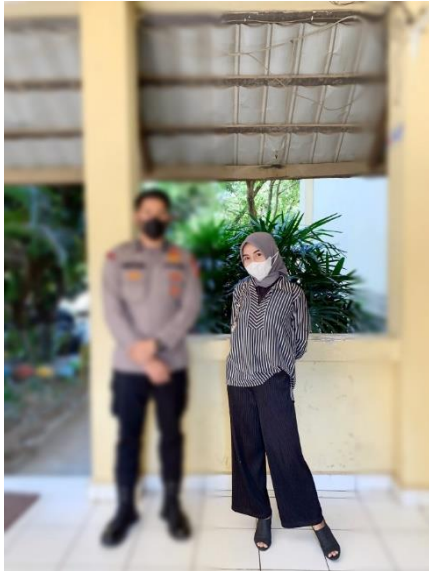
Gambar 1. Berfoto bersama setelah Melakukan wawancara dengan Kepolisian Poldri Kota Makassar