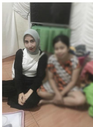
Gambar 5. Berfoto bersama dengan ibu rumah tangga setelah selesai melakukan wawancara