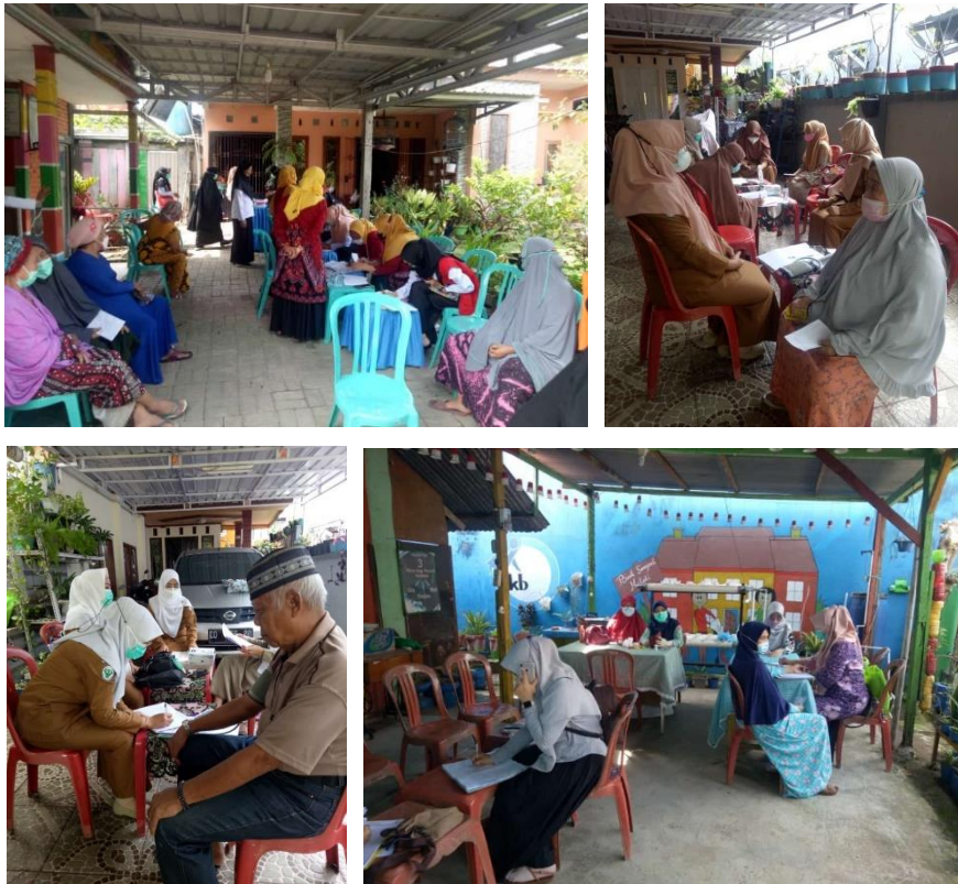
Pelaksanaan Posyandu Lansia di Wilayah Kerja Puskesmas Antara