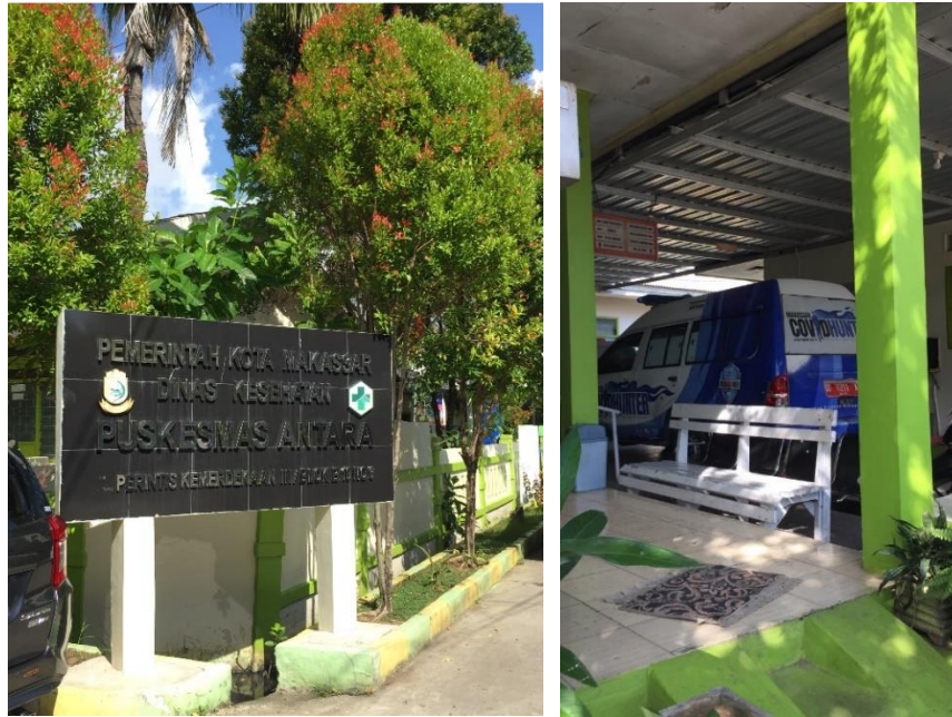
Puskesmas Antara Kota Makassar