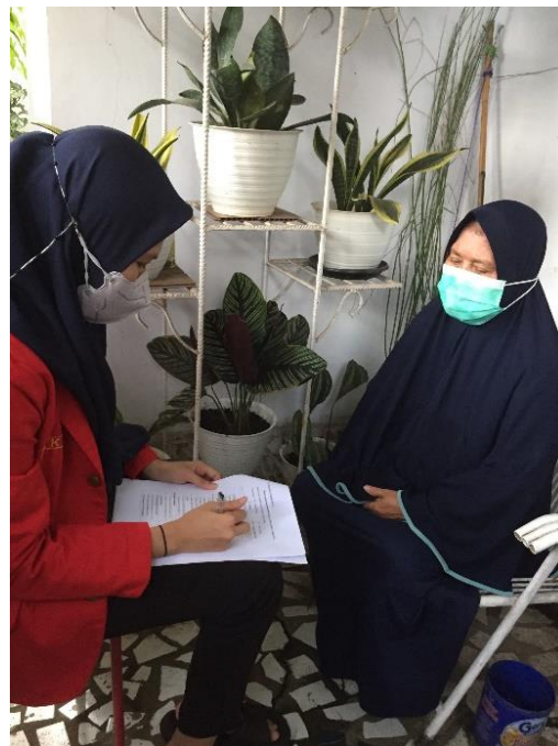
Pelaksanaan Wawancara Kuesioner Penelitian