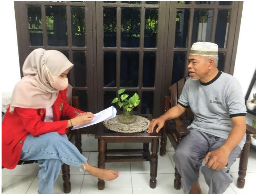
Pelaksanaan Wawancara Kuesioner Penelitian