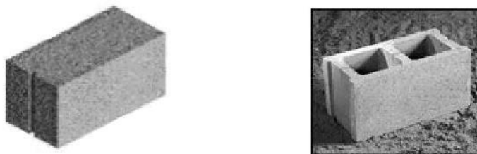
Gambar 2. 1 Bentuk batako