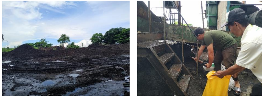
Gambar 2. 3 Abu Ampas Tebu Sisa Pembakaran Pabrik Gula Takalar

Adapun proses terjadinya Abu Ampas Tebu adalah sebagai berikut :