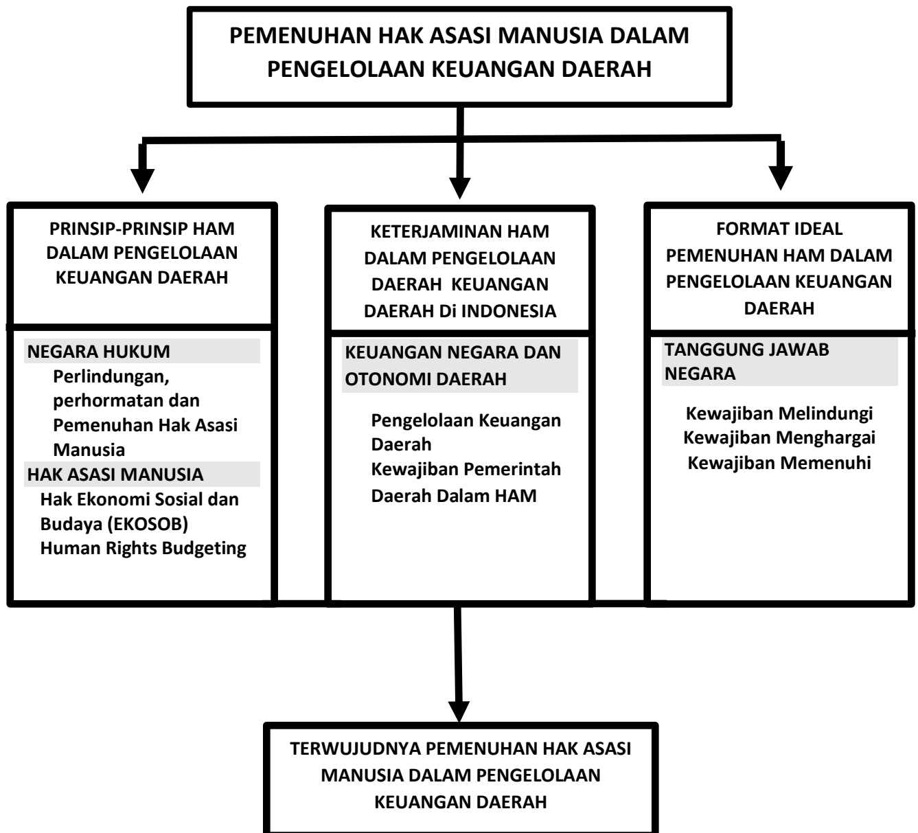
Gambar Kerangka Berfikir