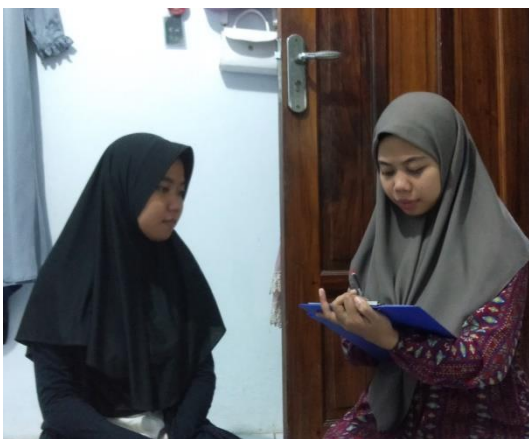
(Umroh, Pempek Kito128)