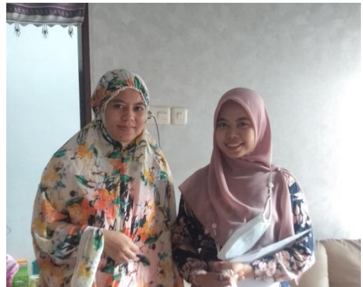
(Nuris, Pempek ssfrozenfoods)