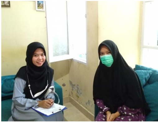
(Reni, Pempek Sriwijaya)