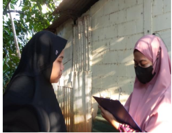
(Yunanda, Pempek Qto)