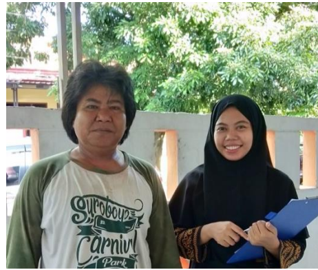
(Aqsyar, Madu Pempek Palembang)