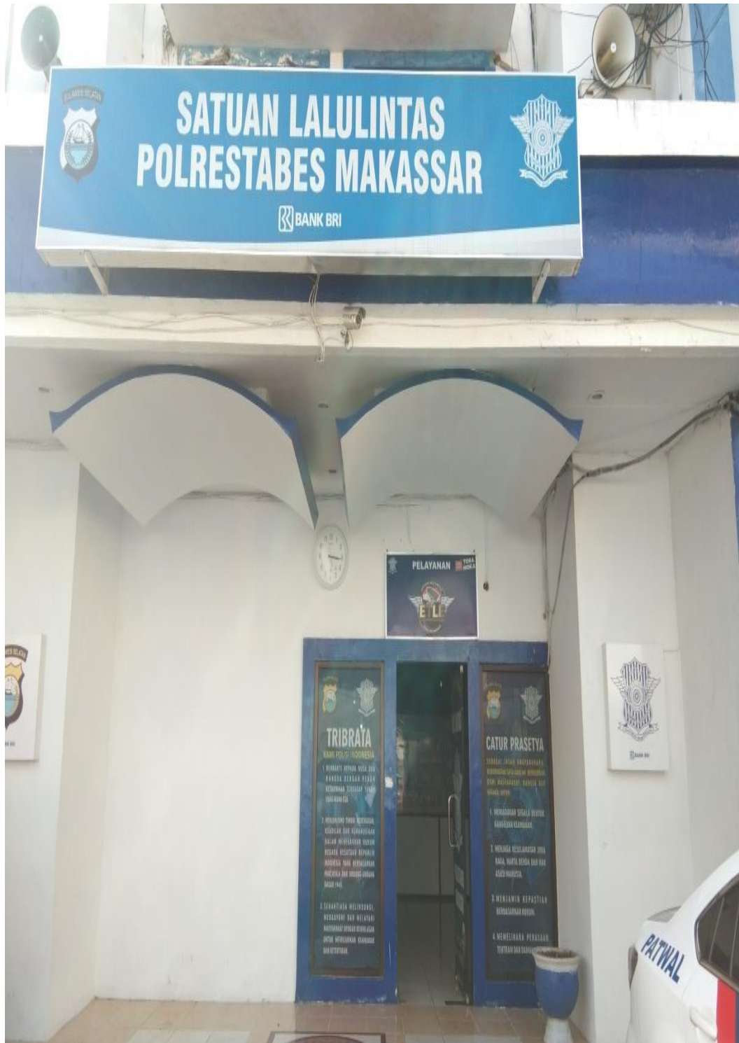
Gambar Tampak Depan Polrestabes Makassar Bagian Satuan Lalu Lintas