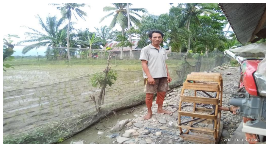
Gambar Unit Bantuan Handtraktor Di Kecamatan Tomoni Timur