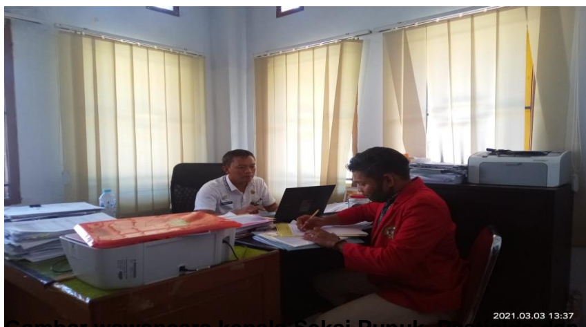
Gambar wawancara kepala Seksi Pupuk, Pestisida dan