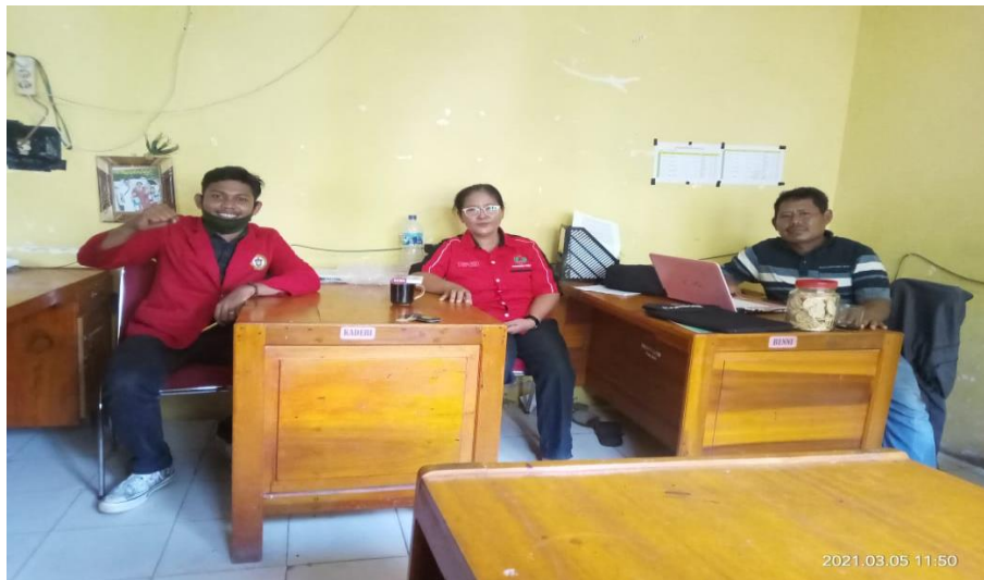
Gambar Wawancara Kepada Beberapa Kelompok Tani Di Kecamatan Tomoni Timur