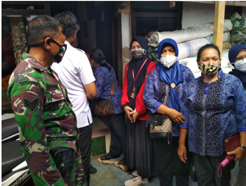
Kegiatan Proses pembagian masker kepada masyarakat di kelurahan tompobalang kecamatan somba opu kabupaten gowa