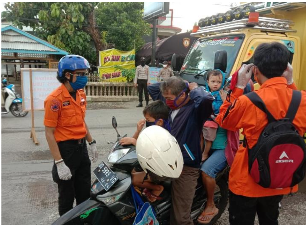
Dokumentasi kegiatan Pembagian Masker kepada Masyarakat