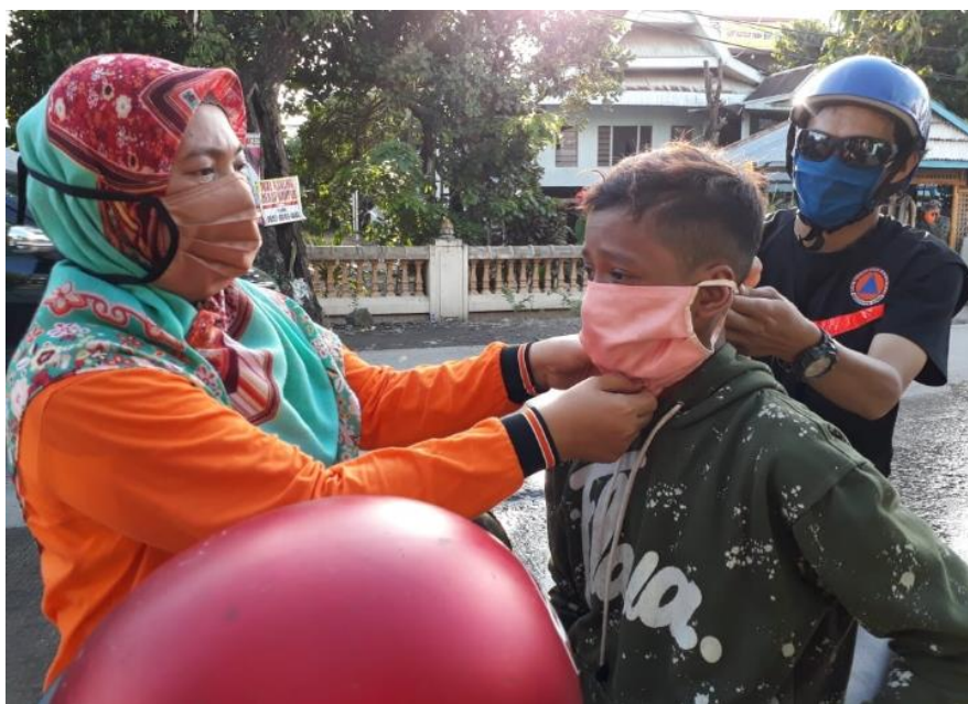
Dokumentasi pembagian masker kepada masyarakat