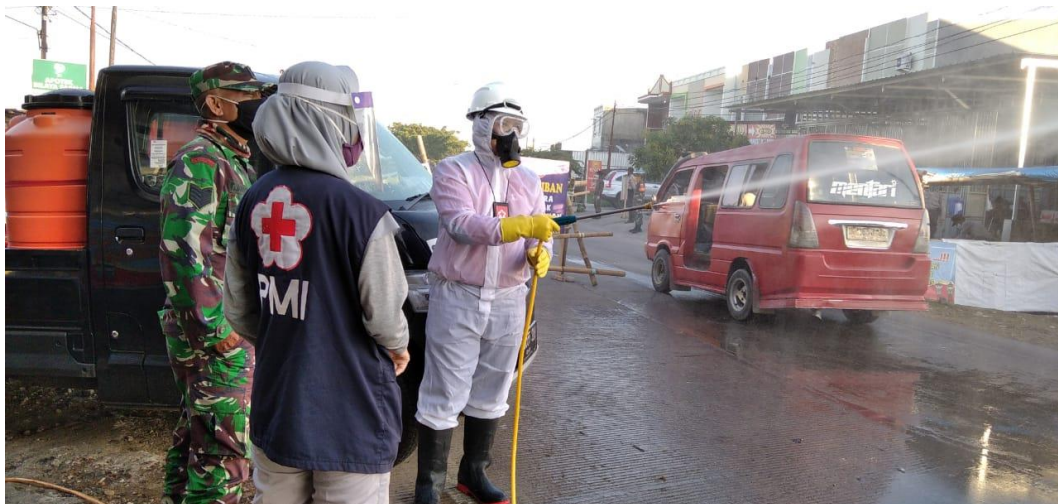
Kegiatan satgas Covid-19 pada saat Kabupaten Gowa melakukan PSBB