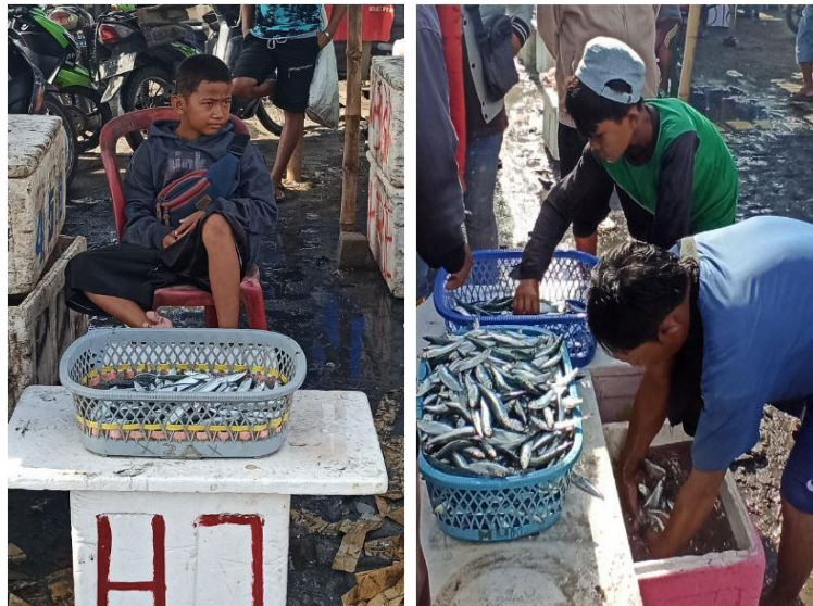
Gambar 5. Anak palelong sedang menggantikan menjual ikan dan aggantang (menyusun ikan dalam basket) bersama palelong dewasa