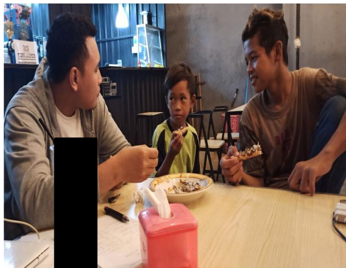
Gambar 9. Wawancara Mendalam dengan Informan AD