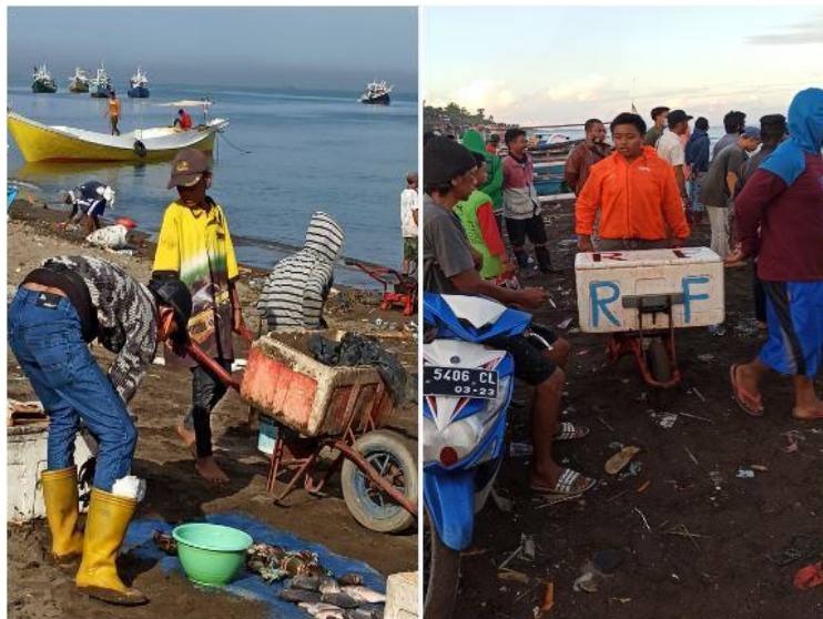
Gambar 4. Anak palelong sedang memindahkan ikan pacato dan papalele dari pantai ke tempat penjualan pabalu