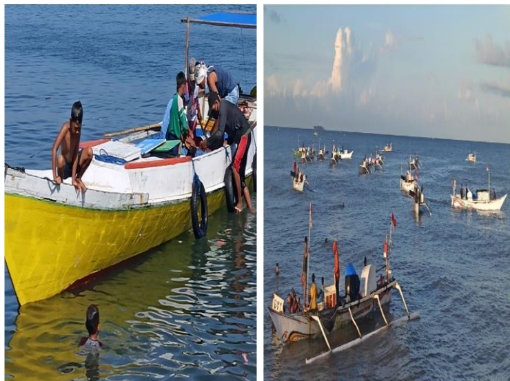
Gambar 6. Anak palelong sedang Annagala (menandai) ikan di Perahu nelayan