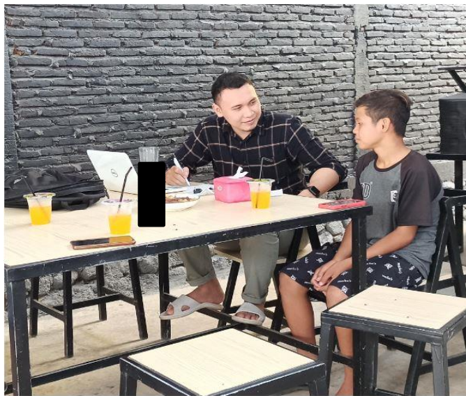
Gambar 13. Wawancara mendalam dengan informan SR