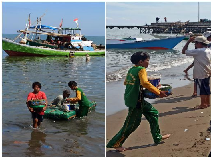
Gambar 2. Anak palelong sedang mengangkat ikan dalam keranjang dari perahu nelayan ke para pcato mereka