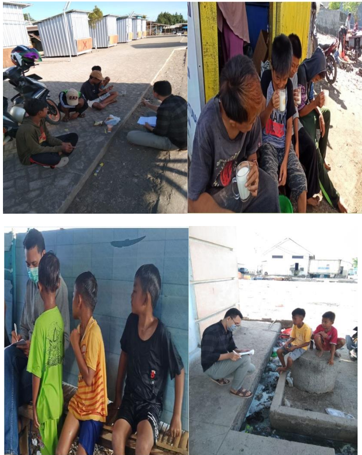
Gambar 7. Wawancara Dilakukan secara Berelompok Untuk Memahami dan menentukan anak palelong yang sesuai Dengan kriteria Informan Penelitian