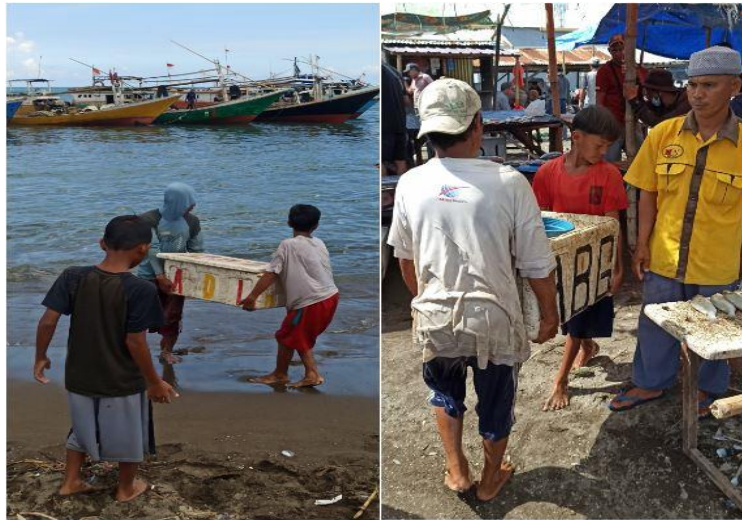
Gambar 3. Anak palelong sedang mengangkat ikan dalam box dari pantai untuk dibawa ke tempat penjualan pabalu dari pacato