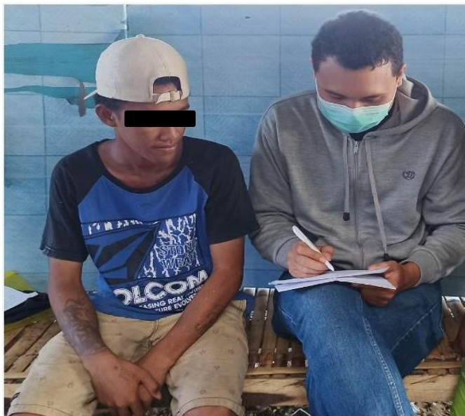
Gambar 14. Wawancara mendalam dengan informan SP