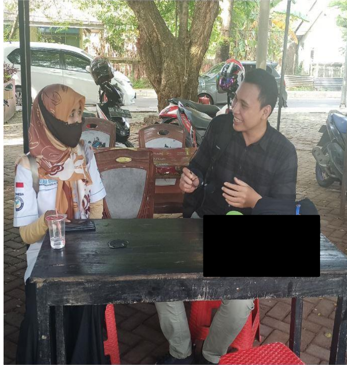
Gambar 16. Wawancara mendalam bersama dengan pendamping SAKTI PEKSOS Kementerian Sosial RI Cq. Dinas Sosial Kab, Takalar