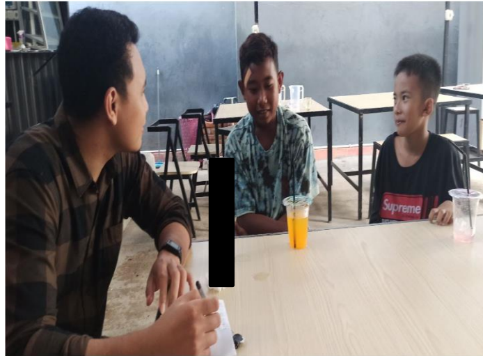
Gambar 10. Wawancara Mendalam dengan Informan IR