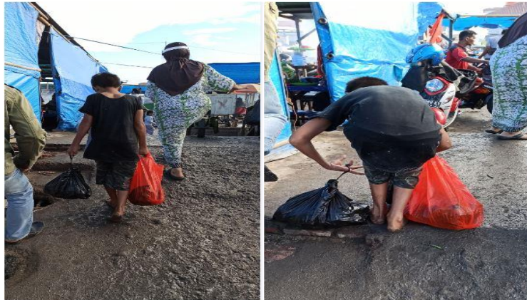
Gambar 1. Anak palelong sedang mengangkat baran belanjaan dari Pakaddokang yang dibeli dari pacato'