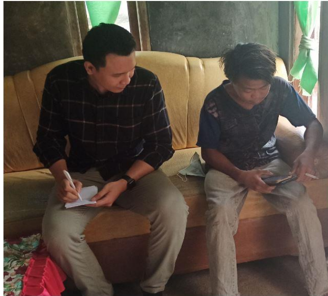
Gambar 12. Wawancara mendalam dengan informan SH