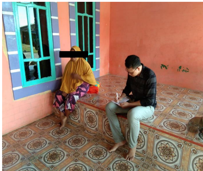
Gambar 15. Wawancara mendalam dengan informan NS