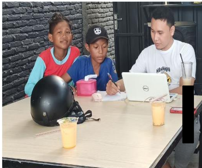
Gamabar 11. Wawancara Mendalam dengan Informan RK dan AB