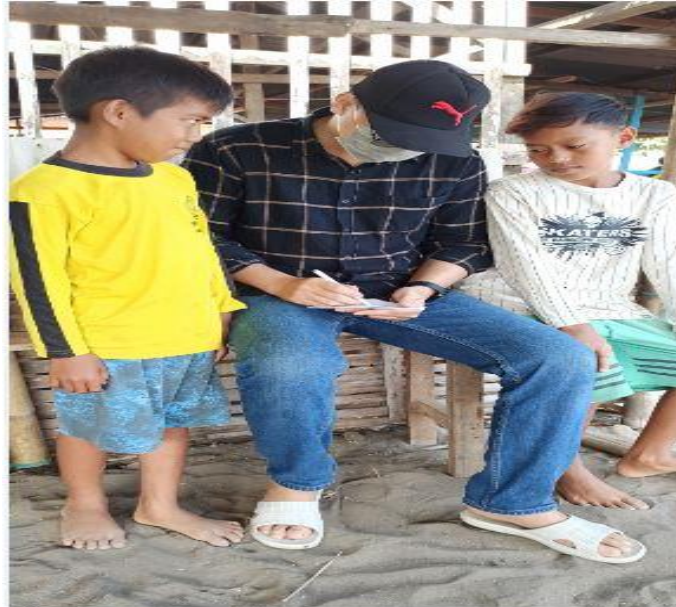
Gambar 8. Kegiatan Wawancara bersama dengan informan SK