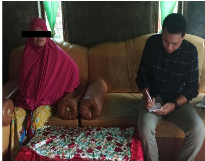
Gambar 15. Wawancara mendalam dengan informan MA