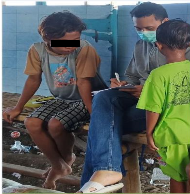
Gambar 13. Wawancara mendalam dengan Informan IP