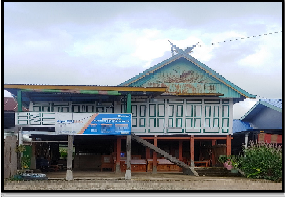
Sekretariat BUMDes Sipurennutta