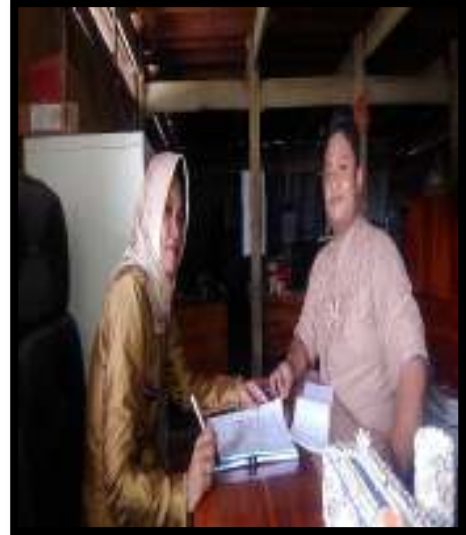
Wawancara Dengan Ketua BUMDes Sipurennutta