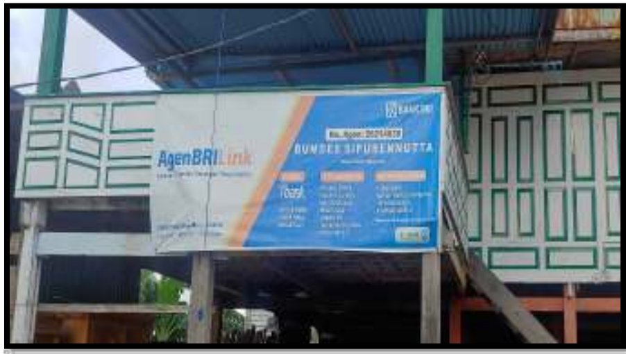
Sekretaria Unit Usaha BRI Link