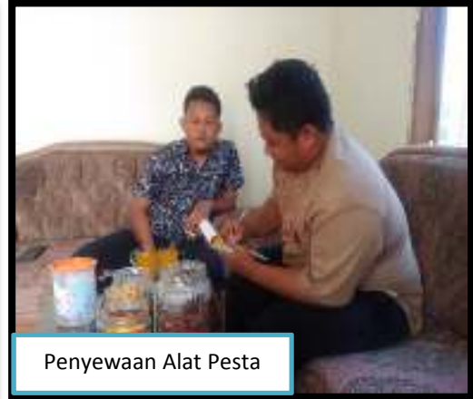
Penyewaan Alat Pesta