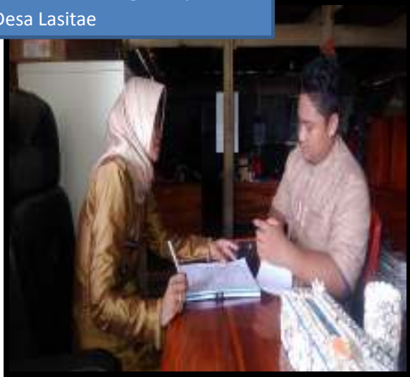
Wawancara dengan Kepala Desa Lasitae