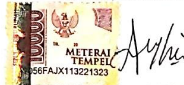
Ainil Azra Mujahidah