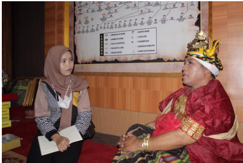
Wawancara dengan Pemimpin Bissu (Puang Matowa)