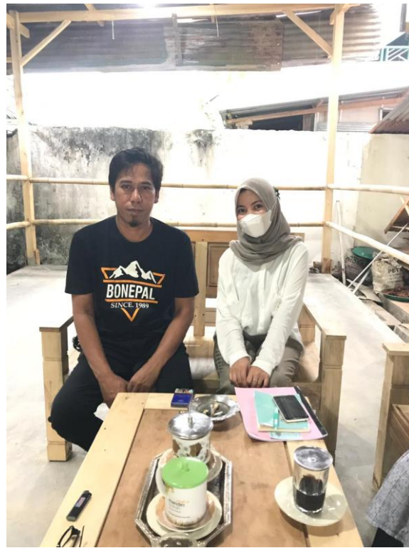
Wawancara dengan Budayawan Kab. Bone