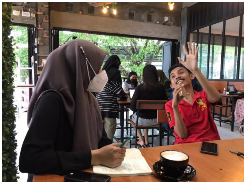
Wawancara dengan Budayawan Muda Kab. Bone