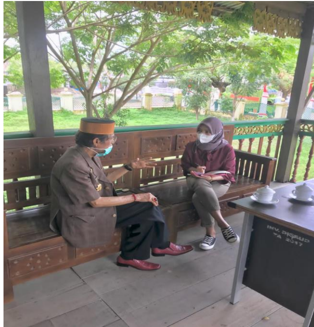
Wawancara dengan Tenaga Ahli Kebudayaan Kab. Bone