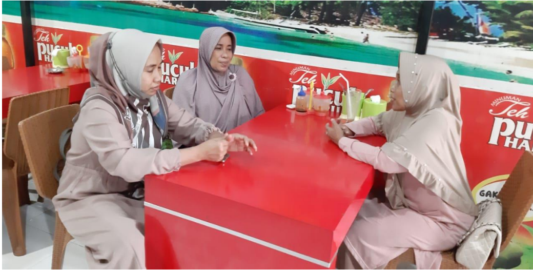
Foto wawancara dengan keluarga informan NU