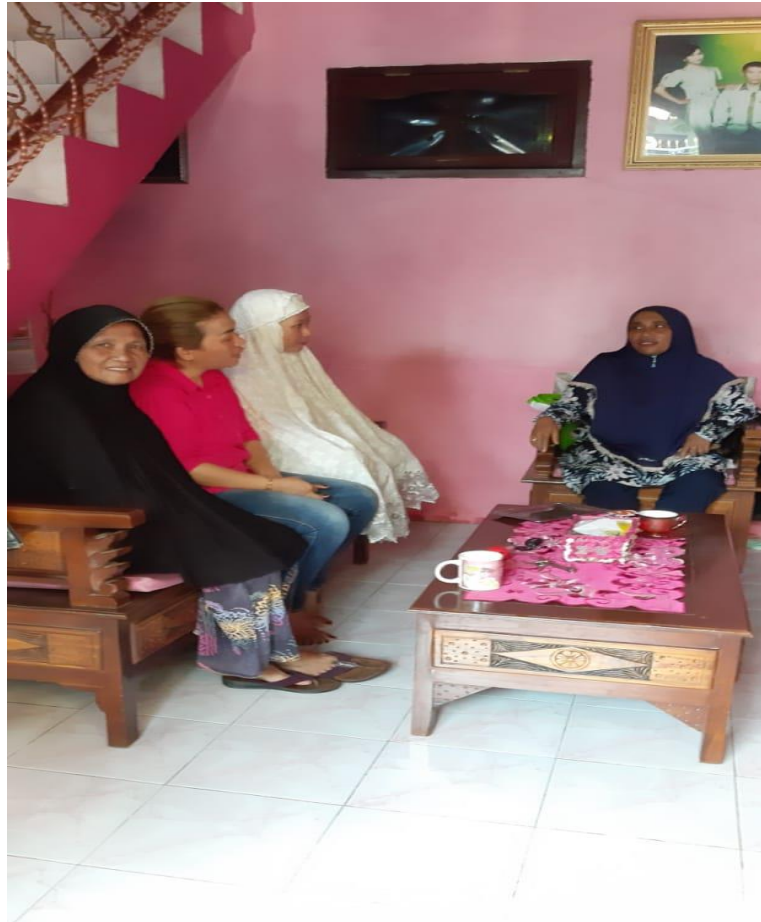
Foto wawancara dengan keluarga infroman TA