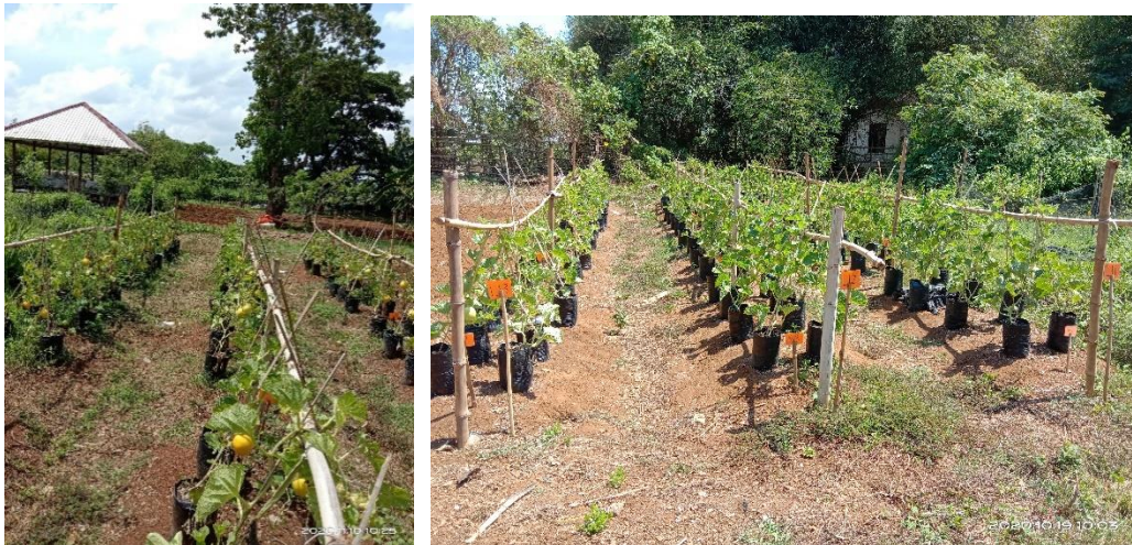
Gambar 8. Kenampakan Kondisi Lapangan di Area Tanaman Melon