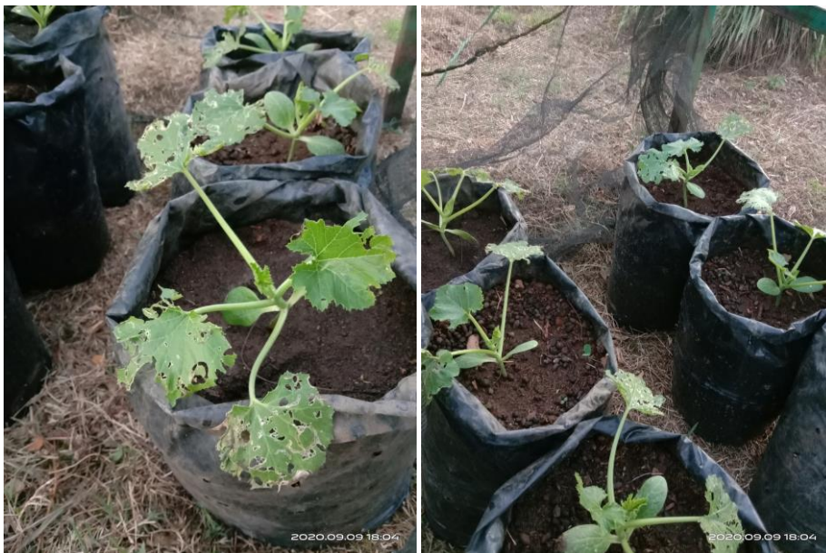
Gambar 16. Kenmpakan serangan A. similis pada daun