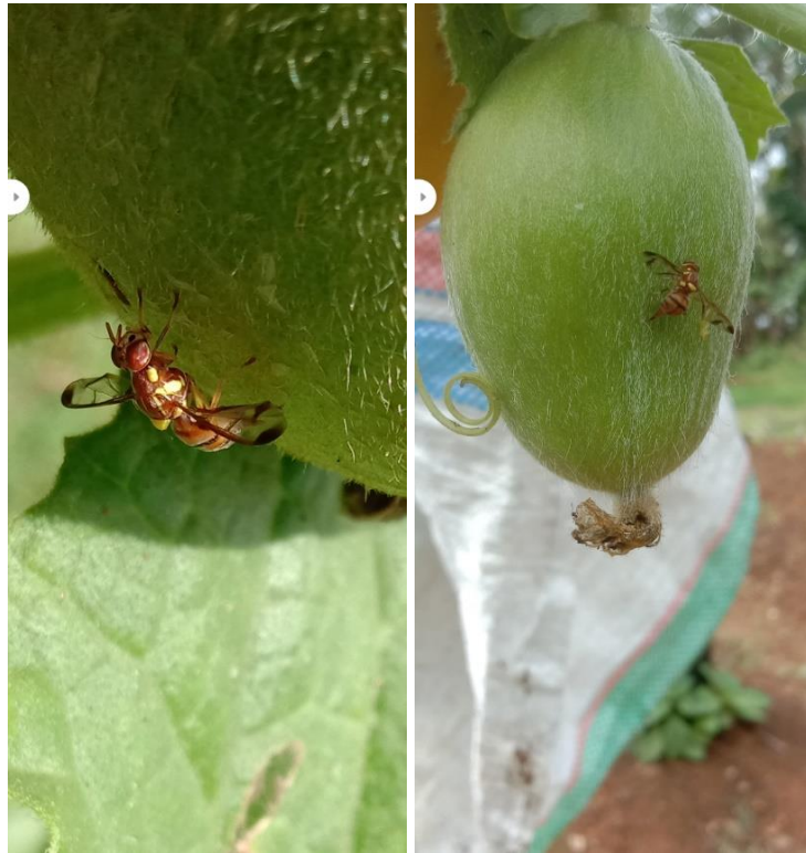
Gambar 15. Spesimen Zeugodacus cucurbitae