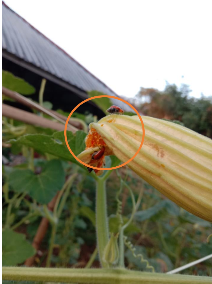
Gambar 17. Kenampakan spesimen A. similis