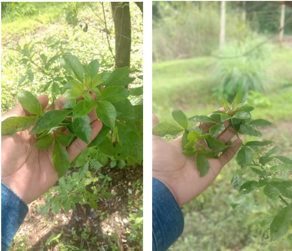
Gambar 11. Kenampakan Daun Legundi ( Vitex trifolia )