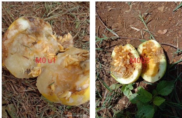
Gambar 14. Kenampakan serangan Zeugodacus cucurbitae