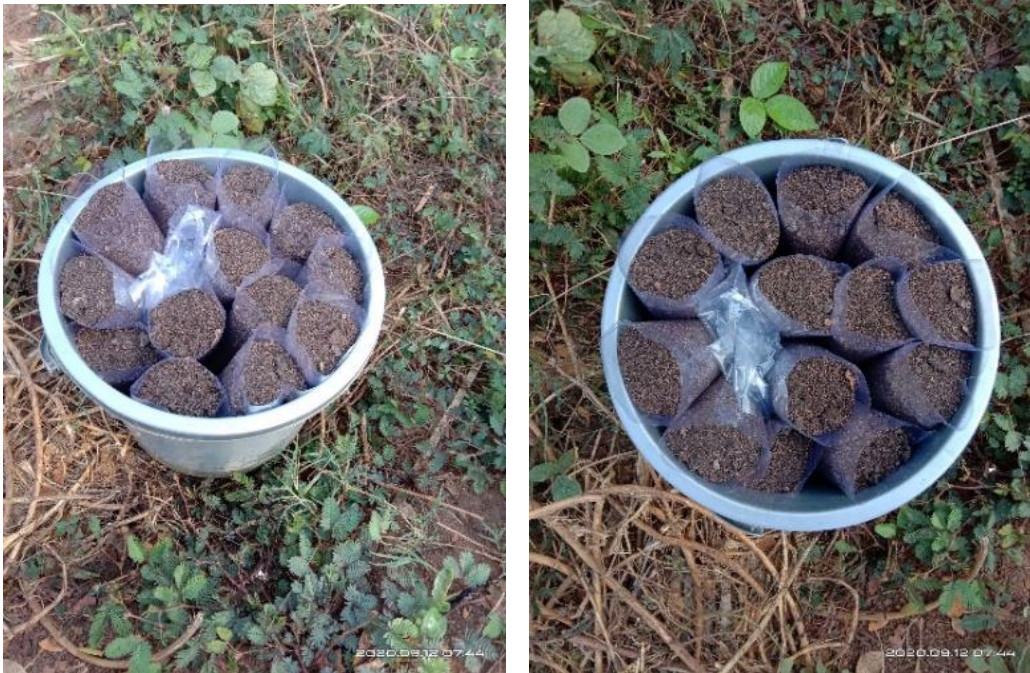
Gambar 10. Kenampakan kagot BSF siap diaplikasikan pada tanaman