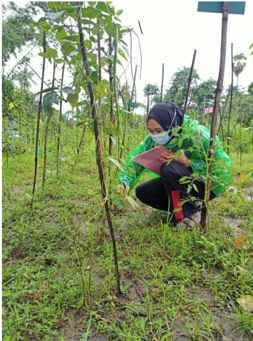
Lampiran 38. Pertanaman Tumpang Sari Sisipan Tomat