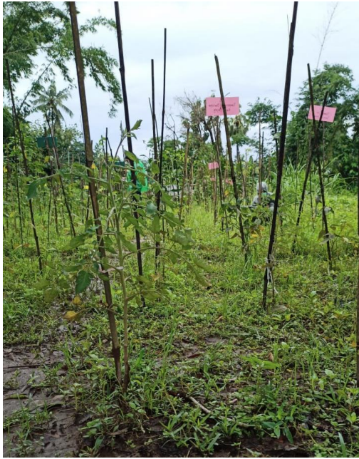
Lampiran 37. Pertanaman Tumpang Sari Berjalur