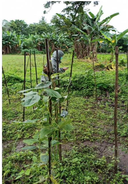
Lampiran 36. Pertanaman Monokultur Kacang Panjang