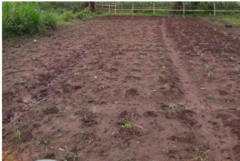
Lampiran 34. Lahan Pertanaman Tomat dan Kacang Panjang

Jerk tanaman dari pinggir petakan = 60 cm