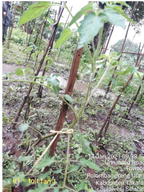
Lampiran 35. Pertanaman Monokultur Tomat