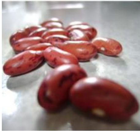
Gambar 2-1. Biji Kacang Merah (Hasanah, 2011).

Tanaman kacang merah bukanlah tanaman asli yang berasal dari daerah Indonesia melainkan tanaman yang berasal dari daerah Meksiko yaitu Toluca, tanaman ini dikenal dengan sebutan kidney beans jika berada di pasaran internasional. Kacang merah juga merupakan jenis kacang buncis yang dipanen ketika telah tua dan hanya diambil bijinya saja ( bush bean ) (Sembiring, 2016).