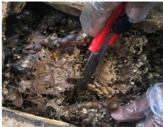
Gambar 1. Sarang Lebah Trigona biroi Pada Stup Kontrol/Glodok

Stup yang digunakan pada penelitian ini adalah berbentuk vertikal. Stup vertikal mempunyai ruang yang sempit serta sirkulasi udara yang lancar. Ruang yang sempit akan membuat suhu didalamnya meningkat sehingga mampu menjaga suhu didalam tetap hangat ini berkaitan dengan sifat alami Trigona biroi dialam dalam membuat sarangnya (Abdilah, 2008).