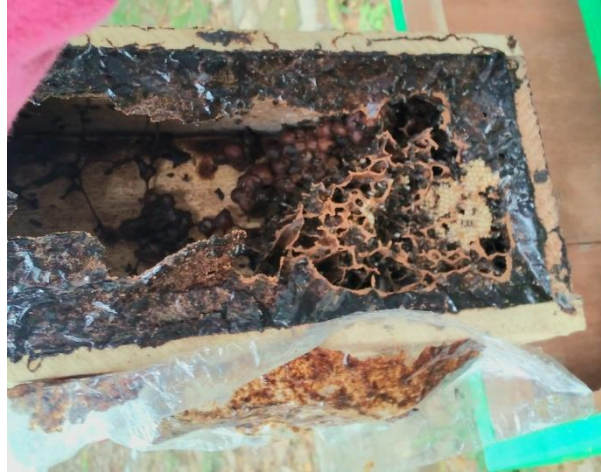
Gambar 2. Sarang Lebah Trigona biroi pada Stup Pengamatan