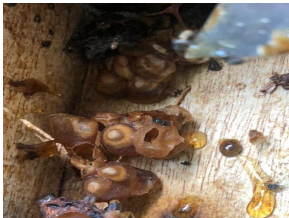
Gambar 3. Produksi Madu pada Stup Pengamatan Lebah Trigona biroi

Madu mempunyai nilai ekonomi yang dapat memperbaiki kesehatan dan gizi masyarakat serta meningkatkan pendapatan peternak lebah. Kandungan madu yang terdapat pada lebah tanpa sengat menghasilkan madu dari nektar tanaman berbunga, kemudian disimpan dalam pot yang terbuat dari serumen lilin, dimana madu terdiri dari glukosa dan fruktosa serta mengandung mineral, vitamin dan nutrisi lainnya. Ini adalah sumber energi utama bagi lebah dan dapat berfungsi sebagai penambah energi bagi manusia. Madu lebah tanpa sengat dapat digunakan sebagai komponen roti, kue dan biskuit serta dalam produksi minuman beralkohol dan non alkohol. Madu lebah tanpa sengat populer karena sifat antioksidan dan antibiotiknya, sehingga efektif dalam menyembuhkan luka dan melawan infeksi internal dan eksternal (Kwapong dkk, 2010).