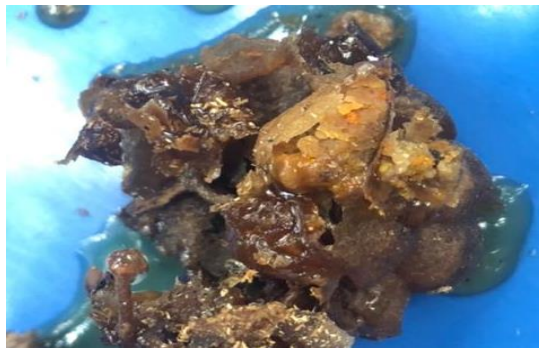
Gambar 4. Hasil Panen Bee Bread Lebah Trigona biroi

Pollen sebagai dasar dalam pembuatan bee bread dimana pollen yang sudah dicampur madu dan dilapisi dengan propolis serta dibentuk seperti bola-bola kecil kemudian disimpan secara berkelompok pada internal sarang lebah tanpa sengat (Lamerkabel, 2007). Serbuk Sari ( bee pollen ) adalah serbuk sari bunga yang diambil oleh lebah pekerja, disimpan pada kaki lebah ( pollen basket ) yang digunakan lebah sebagai sumber protein (Syafrizal dan Budiman, 2013). Bee pollen mengandung bahan kimia alami dengan komposisi yang kompleks, bee pollen mempunyai khasiat yang bermacam-macam, diantaranya adalah sebagai antioksidan. Kekuatan optimum serta daya tahan tubuh terhadap berbagai penyakit bisa diperoleh dengan menambahkan 20% bee pollen pada makanan kita. Bee pollen dengan kelengkapan unsur gizinya, bekerja terutama pada sel-sel metabolisme (Faegri, 1989).