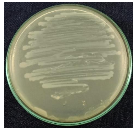
Peremajaan Bakteri Escherichia coli media MHA