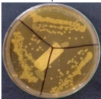
Identifikasi bakteri Staphylococcus aureus Media MSA berwarna kuning