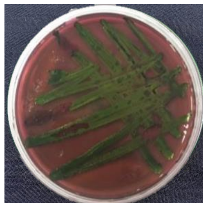
Identifikasi bakteri Escherichia coli Media EMBA berwarna hijau metalik