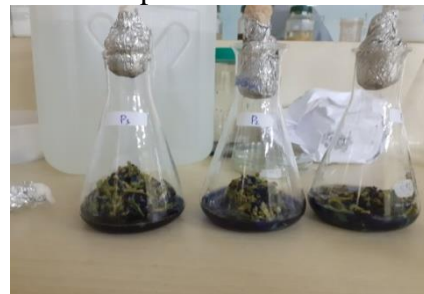
Ekstraksi infusa dengan waterbath