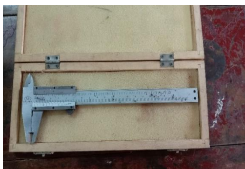
Pengukuran dengan jangka sorong