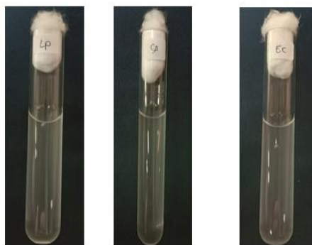
Suspensi standar Mc Farland