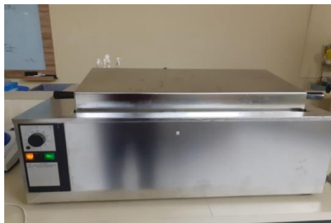
Ekstrak dengan waterbath