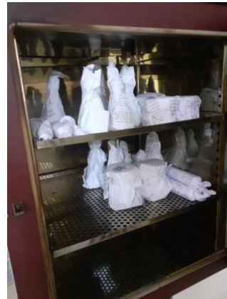
Persiapan alat dan bahan