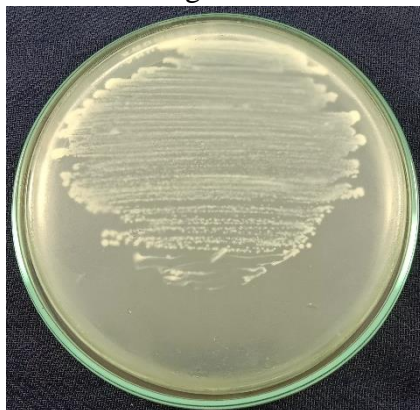
Peremajaan Bakteri Staphylococcus aureus media MHA