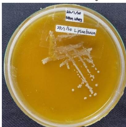
Identifikasi bakteri Lactobacillus sp. Media MRS berwarna putih