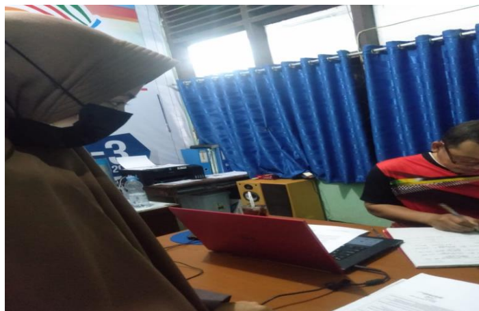
Pengambilan Surat Telah Melaksanakan Penelitian dari SMAN 4 Bantimurung Maros