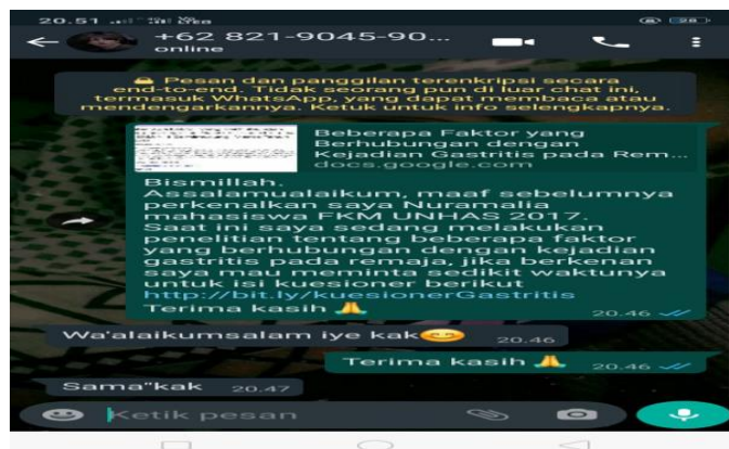
Dokumentasi Menghubungi Responden