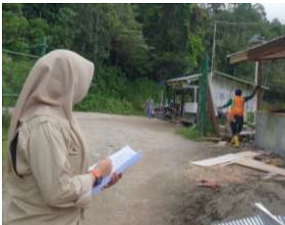
Saat melakukan observasi perilaku pekerja