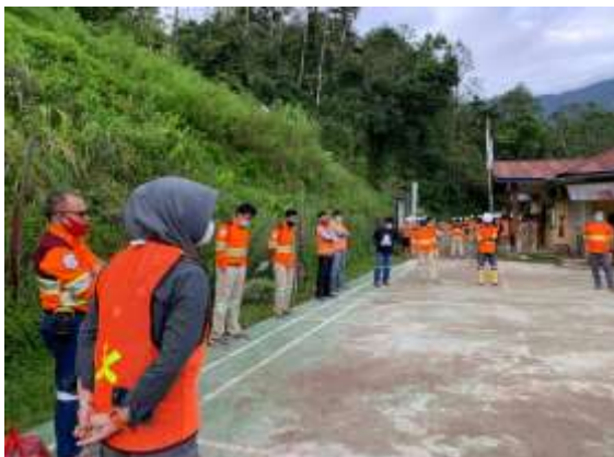
Saat mengikuti Pre Start Meeting pagi