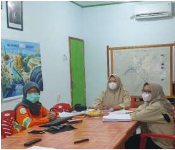
Saat mengikuti safety induction