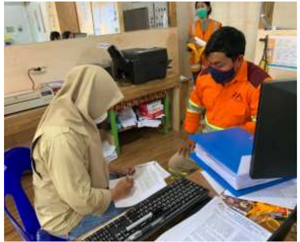
Saat melakukan wawancara