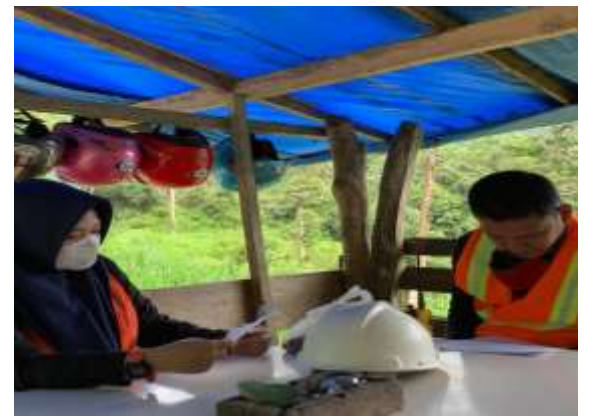
Saat melakukan wawancara