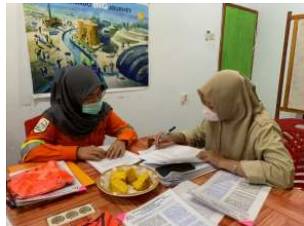
Saat melakukan wawancara dengan KKPLH