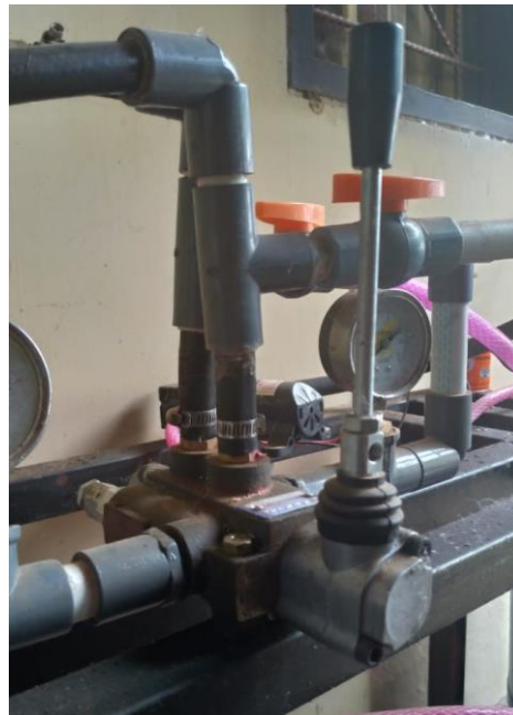
Gambar 3.4 Directional control valve

Seperti yang diperlihatkan pada gambar 3.4 directional control valve pada sistem hidraulik digunakan sebagai pengatur jalur fluida cair untuk masuk dan keluar dari silinder hidraulik sehingga silinder dapat mendorong dan menarik beban.