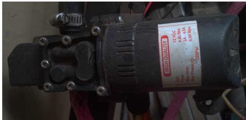
Gambar 3.1 pompa hidraulik

Seperti yang diperlihatkan pada gambar 3.1 pompa hidraulik digunakan untuk mentransfer energi mekanik menjadi energi hidraulik. Pompa hidraulik bekerja dengan cara menghisap fluida cair dari tangki dan mendorongnya ke dalam sistem hidraulik dalam bentuk aliran. Fungsi dari pompa dalam plant sistem hidraulik ini adalah sebagai penggerak dari fluida cair yang akan menghasilkan tekanan.