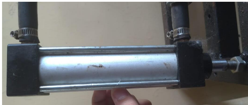
Gambar 3.3 Silinder hidrolik Double Acting

Seperti yang diperlihatkan pada gambar 3.3 silinder hidrolik double acting pada sistem hidrolik digunakan untuk mendorong dan menarik beban.