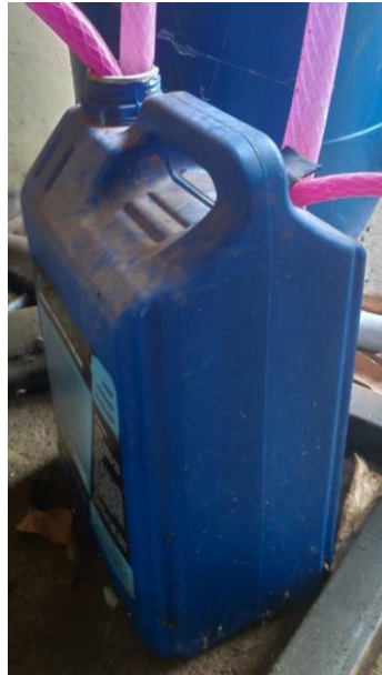
Gambar 3.2 Tangki Fluida/ Reservoir .

Seperti yang diperlihatkan pada gambar 3.2 tangki pada sistem hidrolik digunakan sebagai wadah untuk menampung fluida cair yang nantinya akan dihisap oleh pompa dan bersikulasi.