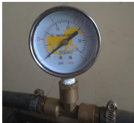
Gambar 3.7 Manometer bourdon

Seperti yang diperlihatkan pada gambar 3.7 manometer bourdon digunakan sebagai alat untuk mengukur tekanan fluida cair yang terjadi pada sistem hidrolik.