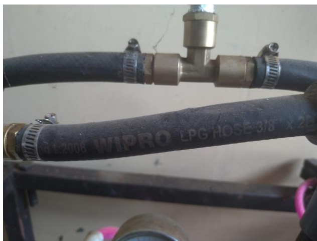
Gambar 3.6 Saluran/ hose

Seperti yang diperlihatkan pada gambar 3.6 hose pada sistem hidraulik digunakan sebagai media fluida cair untuk mengalir ke sistem hidraulik.