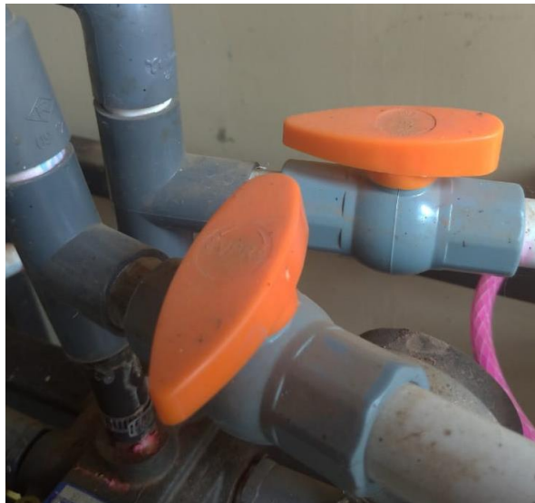
Gambar 3.5 Relieve valve

Seperti yang diperlihatkan pada gambar 3.5 relieve valve pada sistem hidraulik digunakan sebagai pengatur jalur fluida cair yang bertekanan tinggi keluar dari silinder hidraulik menuju tangki sehingga tidak ada tekanan balik yang tertahan.