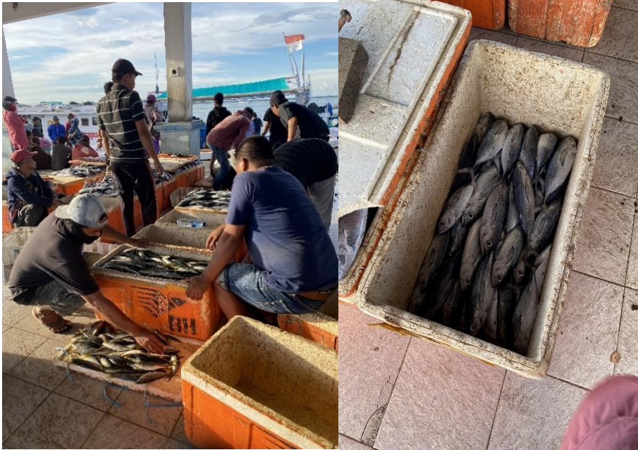
IKAN YANG DITAWARKAN