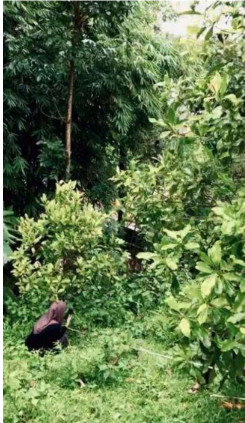
Lampiran 6.3. Pengambilan data primer Unit Lahan 15