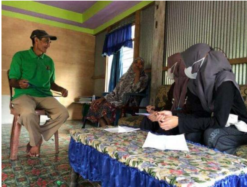
Lampiran 7.1. Wawancara pada unit lahan 11