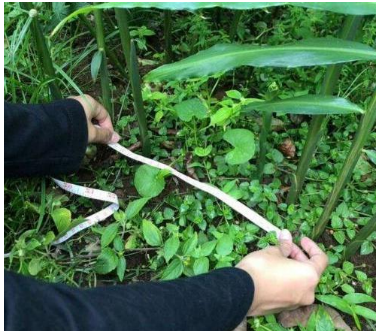
Lampiran 6.2. Pengambilan data primer Unit Lahan 15