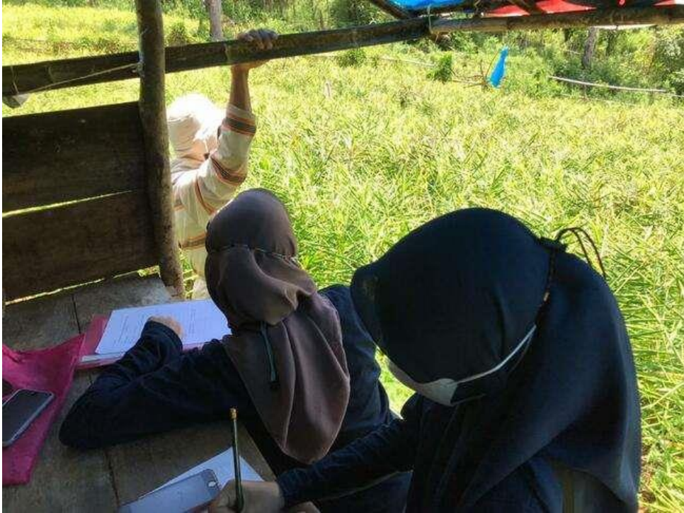
Lampiran 7.3. Unit lahan 14