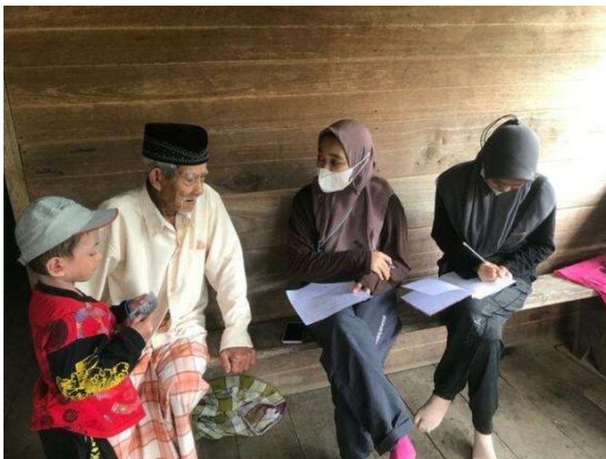
Lampiran 7.2. Wawancara pada unit lahan 3