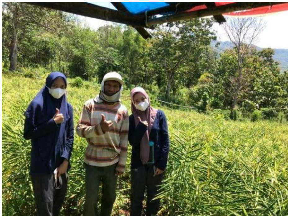
Lampiran 7.4 Unit lahan 14