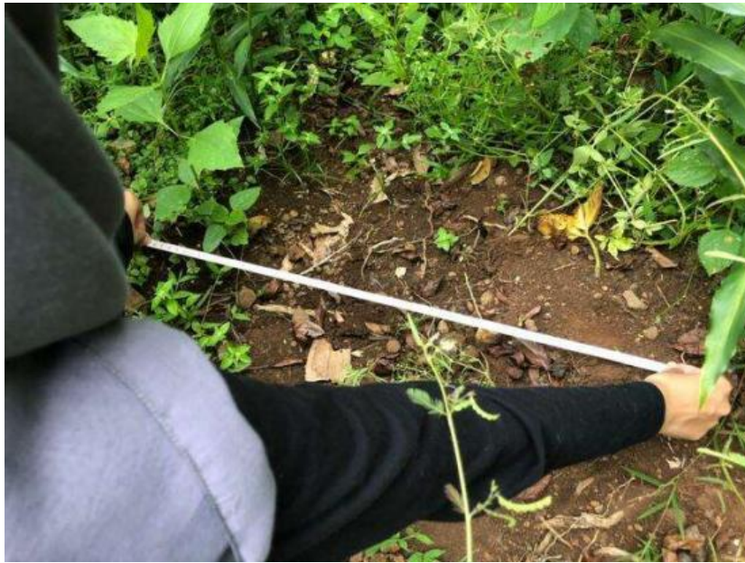
Lampiran 6.1. Pengambilan data primer Unit Lahan 4